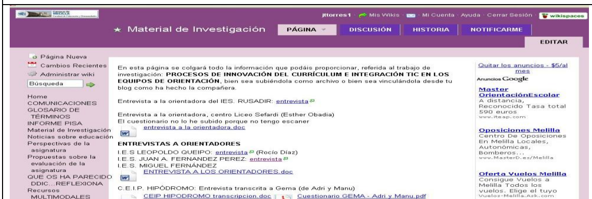
Figura 4. Wiki colaborativa DDIC-Psicopedagogía http://innovacurriculum.wikispaces.com