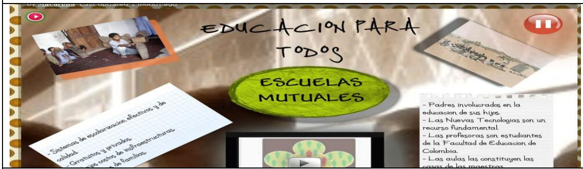
Figura 3. Ejemplo póster digital http://macarena.glogster.com/la-escuela-ideal