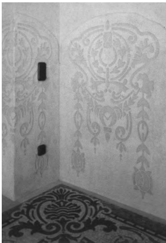
Casa de pagès, Castellbisbal.