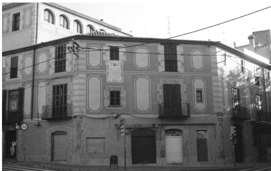
Patisserie Foix, Plaça de Sarrià, Barcelona. Estucat a calç i esgrafiats.

Els antics egipcis ja acabaven i tapaven amb estuc les juntes dels carreus de les pedres de les “pells” dels edificis i, posteriorment que l'estesa era fresca, per a poder-los pintar o policromar. Els carreus són les pedres tallades ordinàriament en forma de paral·lelepípede per a la construcció de murs, pilars i similars. Els carreus constitueixen la primera aportació de l'arquitectura egípcia i fan possible la construcció sense sortints i edificis de perfils rectilinis. Constitueixen un element constructiu regular com el maó.