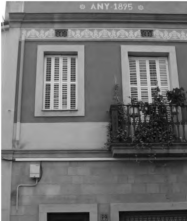
Cal Petit, C/ Bonavista Sant Just Desvern

D'altra banda, una altra manera de fer estuc bàsic és per imitació de pedra picada, embotida i Montjuïc. Totes elles són imitacions que varien poc. Solament en les eines dels acabats de pedra picada formarem un plinto lliscat en els contorns i amb el ganyot del paletí farem uns foradets junts dins l'espai reservat. Per la pedra de Montjuïc seguirem el mateix sistema que l'estuc raspat: estesa al mateix pla cal marcar amb el punxó o junta, a diferents mides, formant figures geomètriques de més de quatre cantons lligats entre ells sense fer línies contínues de diferents plantes. Es poden donar diverses tonalitats, així com omplir el junt i fer al mig un tall de ganivet.