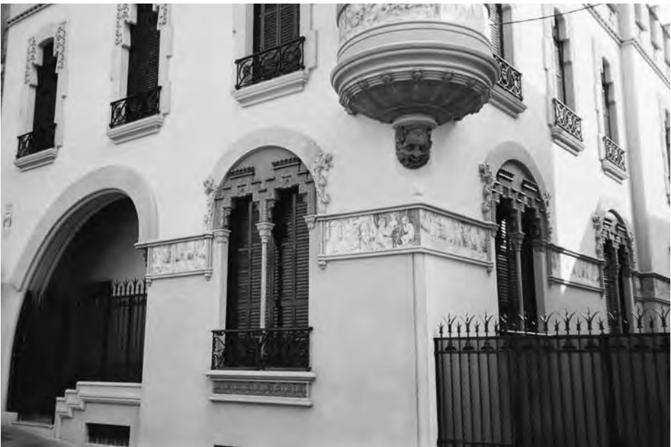
Casa del Senyor Camacho. Torre catalogada per l'ajuntament de Barcelona, situada al carrer República Argentina núm. 40.