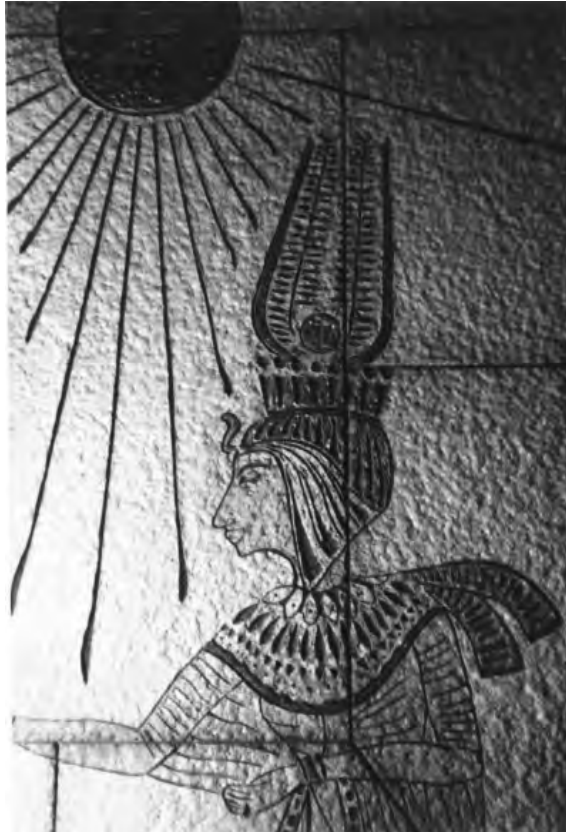
Mural realitzat a Cornellà.

Disposarem del dibuix i el posarem al lloc on vagi. Estendrem dues capes de mescla de calç i marbre magre acabat en un repretat amb pols, lliscat, passat d'aigua i estergit. Amb el canell tallarem l'esgrafiat i amb el paletí picarem el fons.