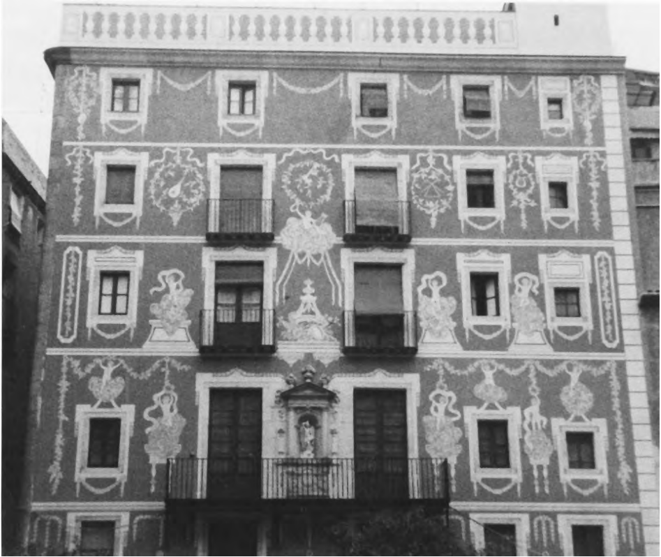
Ganiveteria Roca (Solingen), Plaça del Pi, Barcelona. Estuc esgrafiat.

capa de fons i la superfície que pot arribar a ser entre 20 i 25 mm; a diferència del nostre que és de 5 mm com a mínim, i que es duïen a terme amb plantilla a diferència dels de tradició catalana.