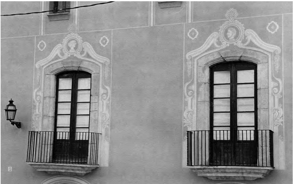
Cal Mercader, Torredembarra. Estucat a calç i esgrafiats.

Entrem en matèria professional per conèixer detalls, petits grans secrets de la professió d'estucador. D'antuvi, el material principal per l'estucat és la calç, junt amb l'arena de marbre, des de granada a fina, passant per pols sempre blanca. La calç millor cuita amb llenya i, si pot ser, del Lledoner (que prové del forn de l'Ordal). Segons quin sigui el gruix de l'estuc, la càrrega de gra serà més elevada; normalment, per tres quarts de bidó de calç hi barrejarem 120 quilos d'arena. La tonalitat del color serà sempre superior al cinc per cent de la mostra per la pèrdua que tindrà quan s'assequi a la paret. La col·locació de l'estuc és aconsellable si l'arrebossat no és nou. Cal passar-hi aigua o rascar-lo si no és correcte. Atès el cas que el gruix de l'estuc sigui superior a tres centímetres es pot reforçar amb griffi o portland.