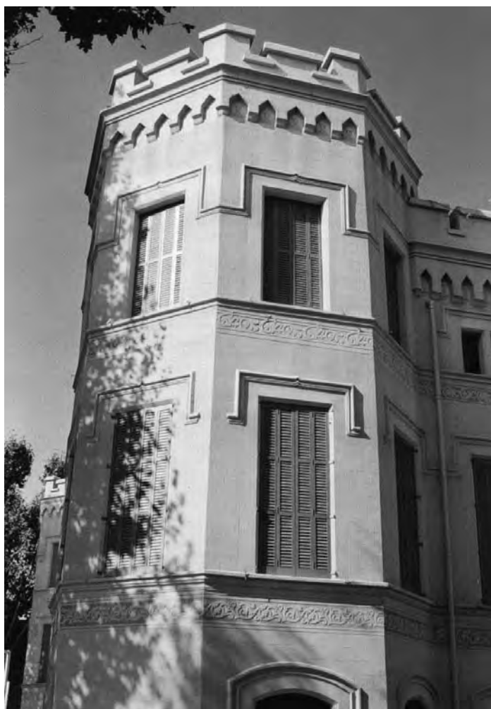
Can Mercader, Cornellà. Estuc amb ciment i voladura de frisos.