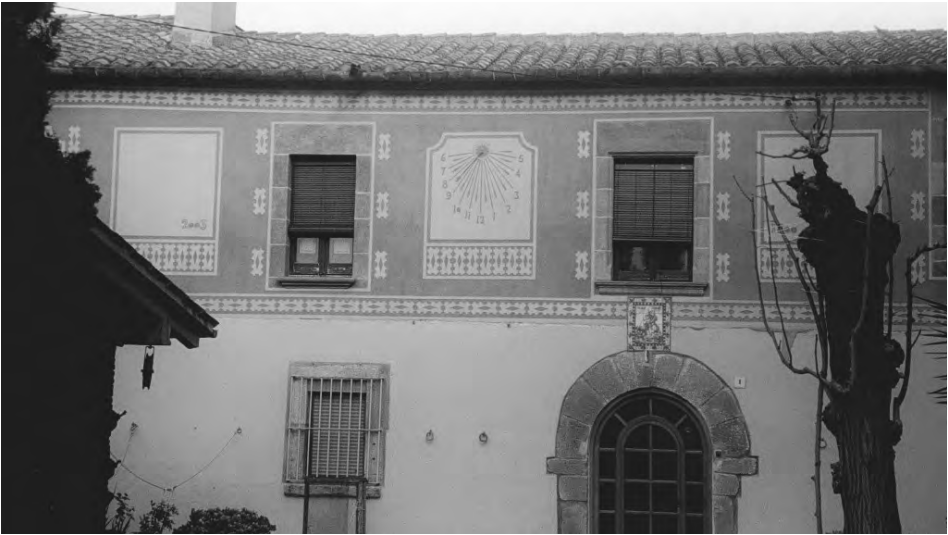
La foto de dalt ens presenta la façana de Can Cardona abans de la restauració. A sota, un cop acabada.