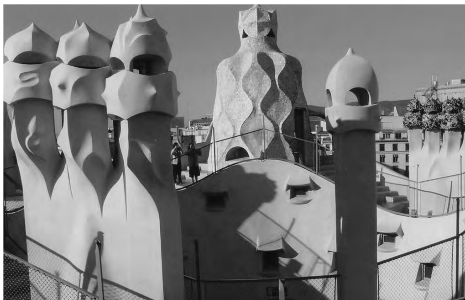
Cares i escales de la Pedrera, Barcelona.