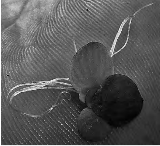
FIGURA 2. Detall de l'espècie, en què es poden apreciar les diverses arrels que la distingeixen de Lemna sp.