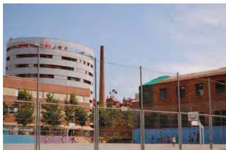
Figura 9. Vista general zones 20 i 29. Pisos de nova planta, conservació d'elements industrials i un nou equipament públic