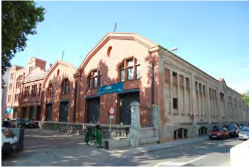
Figura 7. Edifici Acondicionaments i Docks de 1897. Conservat, actual seu de l'ESDI (zona número 5)