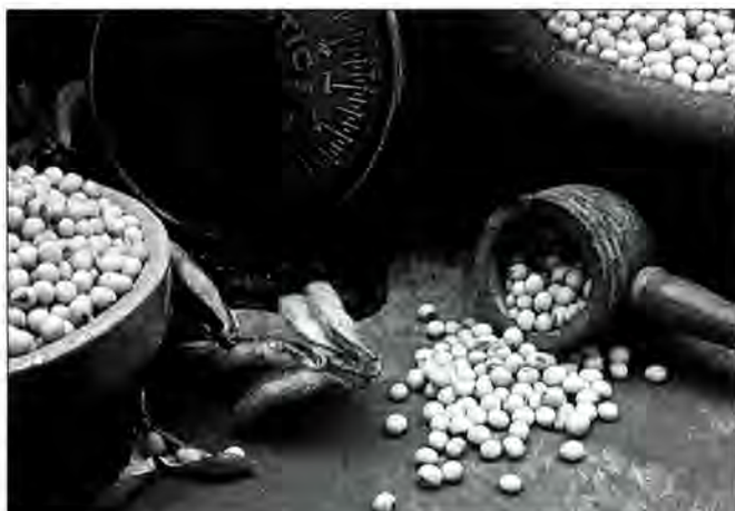
Figura 4. Soia Round-Up Ready, resistent als herbicides, a l'interior de la tavella.

El 1994 es va obtenir l'aprovació de l'USDA i l'FDA per a sis noves varietats de soia i el 1995 es va rebre el registre de l'EPA per a l'utilització del Round-Up amb aquesta planta. Es va demostrar «l'equivalència notable» entre la soia d'enginyeria genètica i les varietats no produïdes mitjançant enginyeria, i es va considerar que les concentracions de la proteïna introduïda a l'oli processat i al menjar eren insignificants. El 1996, als EUA es van plantar totes les llavors disponibles en mig milió d'hectàrees i es preveu que el 1997 es plantaran entre 3 i 4 milions d'hectàrees amb soia Round-Up Ready.