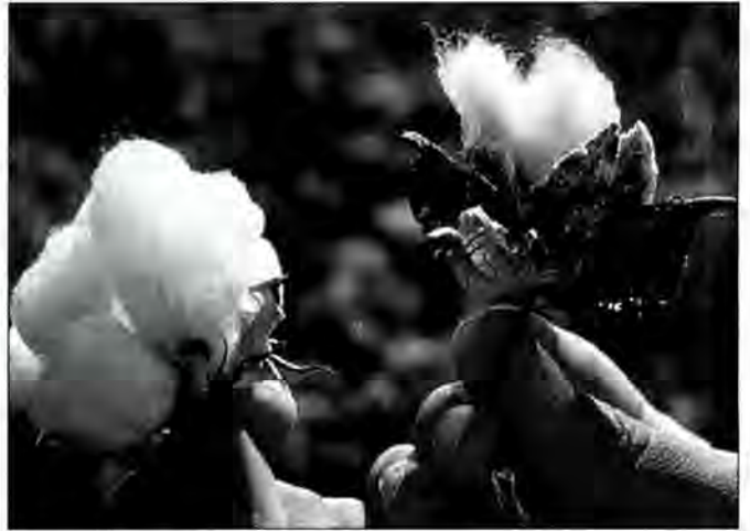
Figura 3. Cotó Bollgard protegit enfront dels insectes (esquerra) comparat amb el cotó tradicional no tractat.

Els agricultors que cultiven plantes protegides amb B. t. redueixen considerablement la quantitat de productes químics necessaris per controlar les plagues principals d'insectes i gaudeixen de rendiments superiors com a resultat de menors danys causats pels insectes i per l'aplicació de plaguicides. Segons l'empresa, l'any 1996 els agricultors dels EUA van tenir una millora mitja del rendiment d'un 7 % amb les noves varietats i es van estalviar uns 13 dòlars per hectàrea amb un augment del rendiment i una reducció dels costos de control d'insectes.