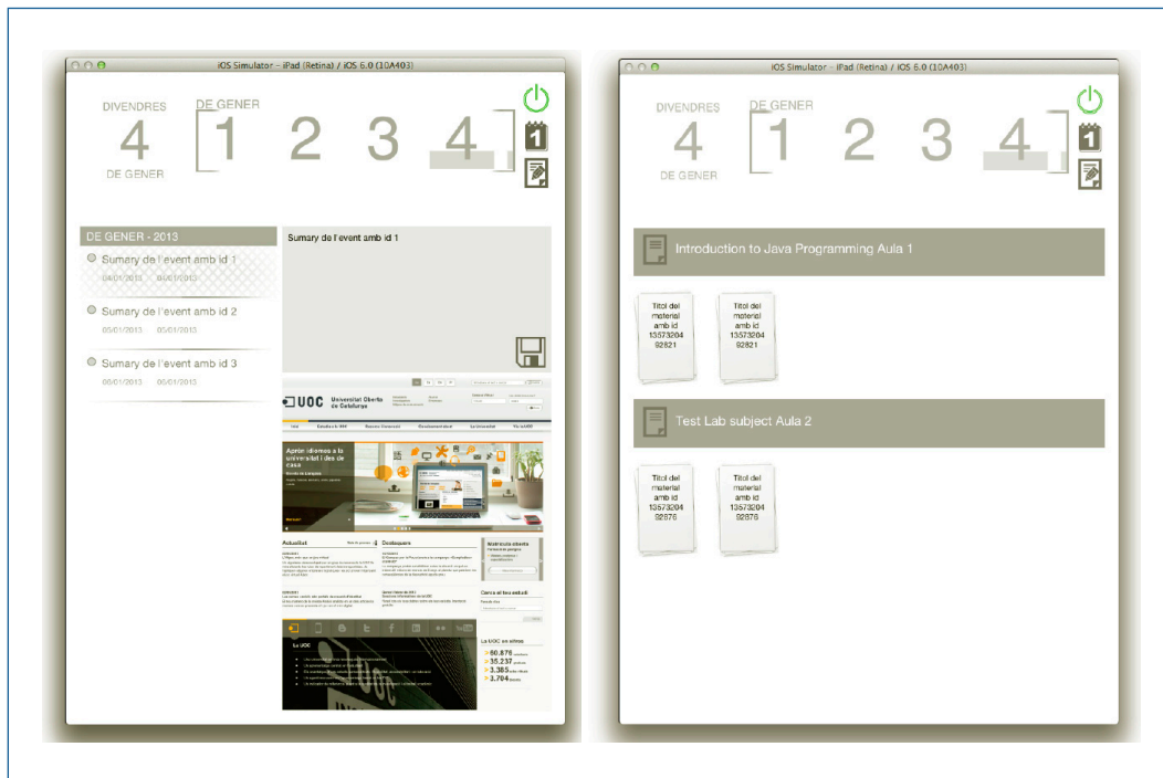
Figura 2. Capturas de la interfaz de la aplicación iUOC

Además de la aplicación resultante, este estudiante ha ofrecido a la UOC la librería desarrollada que conecta con la OpenAPI, para facilitar el desarrollo de aplicaciones más avanzadas. Asimismo ofrece una versión de código abierto de esta, que ha desarrollado gratis para la institución; se reserva la versión completa para ofrecerla al público en general en una tienda de aplicaciones.