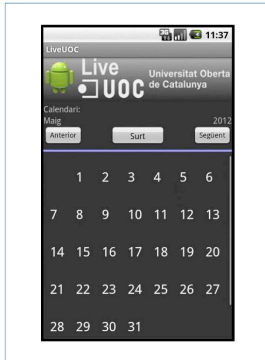
Figura 1. Imagen de la aplicación LiveUOC

Las tecnologías que se utilizaron en este proyecto fueron Android (como plataforma), Java (como lenguaje de programación) y JSON (como mecanismo de intercambio de información). Además, para realizar estas tareas, la aplicación móvil interactúa con el Campus Virtual a través de una API que ofrece servicios de identidad, mensajería, etc., de acuerdo con el estándar LTI 1.1 (IMS, 2012).