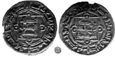
Dírhams del segle X