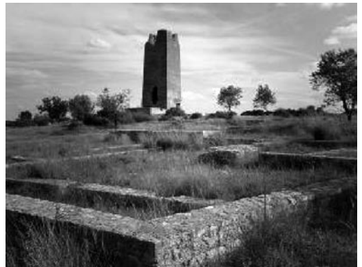
Alqueria andalusina de Bofill, València, amb la torre, restes de les cases i la cerca o muralla que l'envoltava.