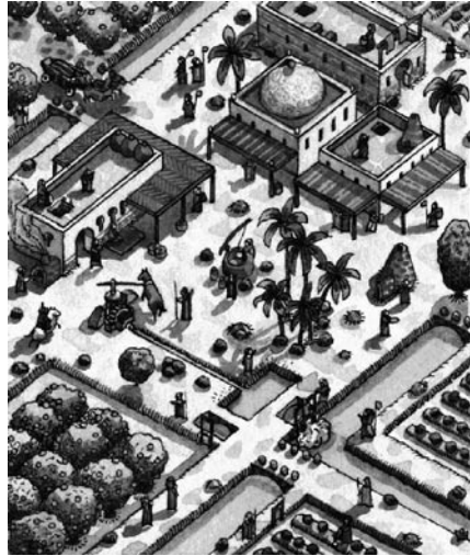
Imatge virtual d'una alqueria àrab, amb el mas, l'horta, les séquies, les sènies, els cultius...