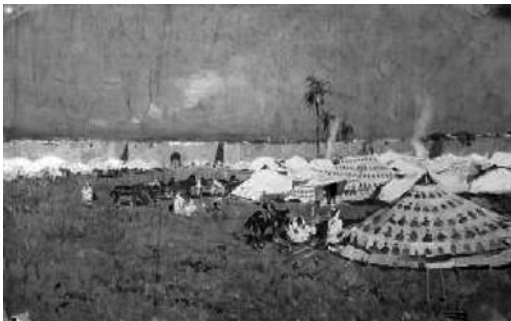
Tendes berbers dins d'un recinte fortificat. L'interior de l'albacar no devia ser gaire diferent de la imatge durant un període de crisi.