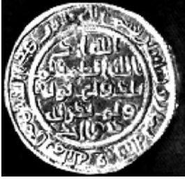
Dírham del segle VII, Iraq