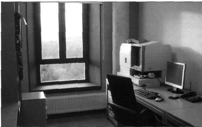
Sala de consulta de l'Arxiu Històric d'Hostalric

Fins al dia d'avui el fons Cabrera i Bas havia estat poc consultat degut a la seva llunyania i a l'inconvenient d'haver-se de desplaçar per accedir a la documentació. En aquests moments els documents ja són a l'abast dels estudiosos i investigadors de Catalunya.