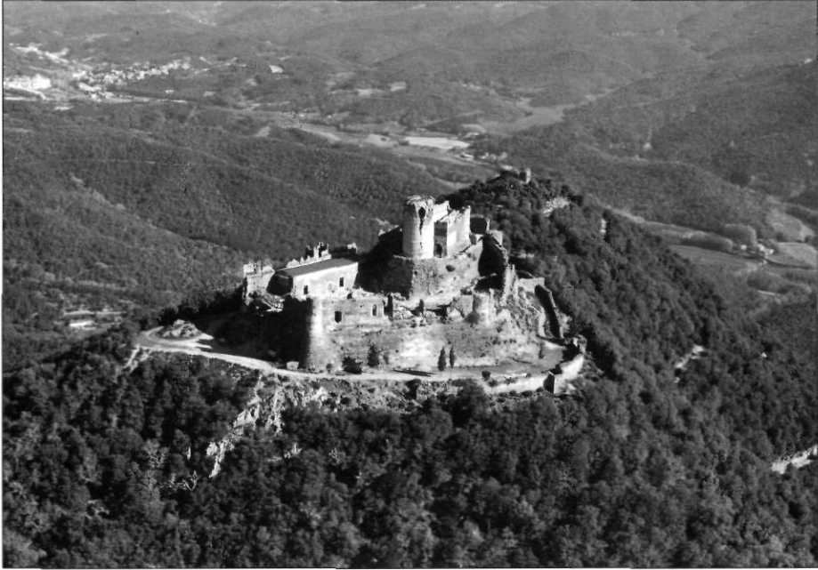
Castell de Montsoriu

La primera notícia documentada de l'arxiu dels Cabrera data de les darreries del segle XIV: