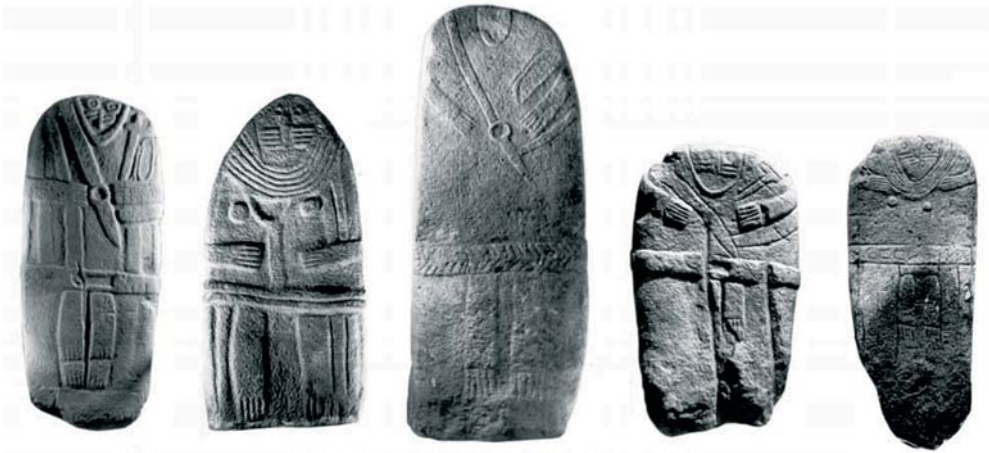
Figura 4. Estàtues-menhirs de la Rouergue (d'esquerra a dreta): La Jasse du Terral I, Saint-Sernin, Les Maurels, Les Vignals i Frescaty. (SERRES 1997).

ment ben diferenciats. Les estàtues-menhir rouergades són les úniques escultures antropomorfes que representen un personatge sencer, incloses les cames. Aquestes cames es troben juntes en les estàtues-menhirs masculines i obertes o separades en les figures femenines, amb els 5 dits de cada peu perfectament figurats. 36 (fig. 4)