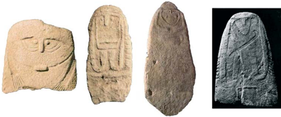
Figura 3. Estàtues-menhir del Lenguadoc (d'esquerra a dreta): Saint-Théodorit, Maison-Aube, Collorgues (Foto 1 i 2: Musée d'Histoire naturelle Nîmes, foto 3: Musée de Lodève, dins D'ANNA 2002) i Rosseironne (ARNAL 1976).

altres regions, la representació dels pits indica la presència de personatges femenins, igual que les armes ho serien dels masculins. Moltes d'aquestes estàtues i esteles han estat descobertes en contextos arqueològics i algunes semblen associades a monuments funeraris i llocs cerimonials. Amb tot, aquestes construccions cobrien un llarg període de temps a finals del IV mil·lenni i tot el III mil·lenni, per la qual cosa resulta difícil assignar-los una cronologia precisa. 28