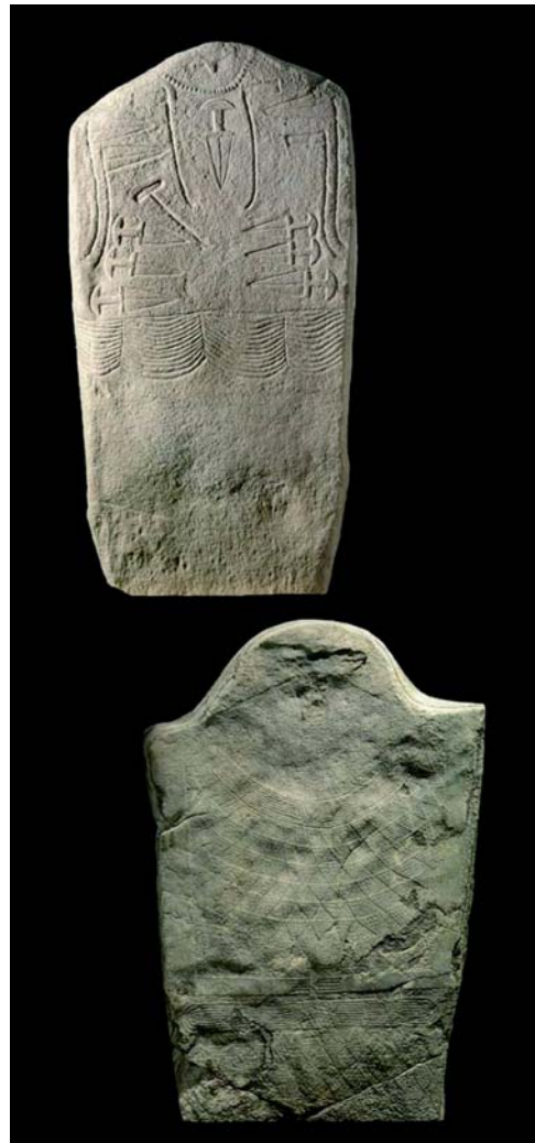
Figura 2. A dalt: estàtua-menhir d'Arco I a Moletta Patone (Trento, Itàlia) (215 cm) (Foto: CESARE i MANUSARDI, dins BELLEY et al. 1998: 157). A sota: estela n.3 sud d'Aosta a Saint-Martin de Corleans (Vall d'Aosta, Itàlia) (192 cm) (Foto: CESARE i MANUSARDI, dins BELLEY et al. 1998: 177).

Les estàtues-menhirs a Còrsega i Sardenya. A Sardenya podem distingir dos grups morfològicament diferents; el tipus «Tamuli» al nord-oest, són estàtues de petita talla amb base plana i cos fusiforme o cònic amb representació dels pits. El tipus «Laconi», el més nombrós, localitzat al sud-est, es compon de monuments probablement organitzats en conjunts extensius i marcant un territori. Aquestes estàtues-menhirs són cuidadosament repica-