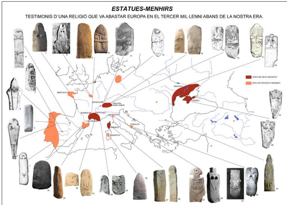
Figura 1. Estàtues-menhirs a Europa. Fotos i dibuixos: 1, 2, 4, 8, 15, 16, 17, 18, 19, 20, 21, 22, 23, 26, 7, 28- ARNAL 1976; 2.-SANTONJA i SANTONJA 1978; 3.-JORGE 1999; 5.-PORTELA i JIMÉNEZ 1996; 6.-ROMERO 1981; 7.-HELGOUACH 1993; 9, 10, 13, 14, 29, 30, 31 i 32.-AA.VV 2002; 11.-MULLER 1997, 12.-MASSET; 24 i 25 AMBROSI 1972; 26 i 27; 34.- LÓPEZ et al. en premsa.