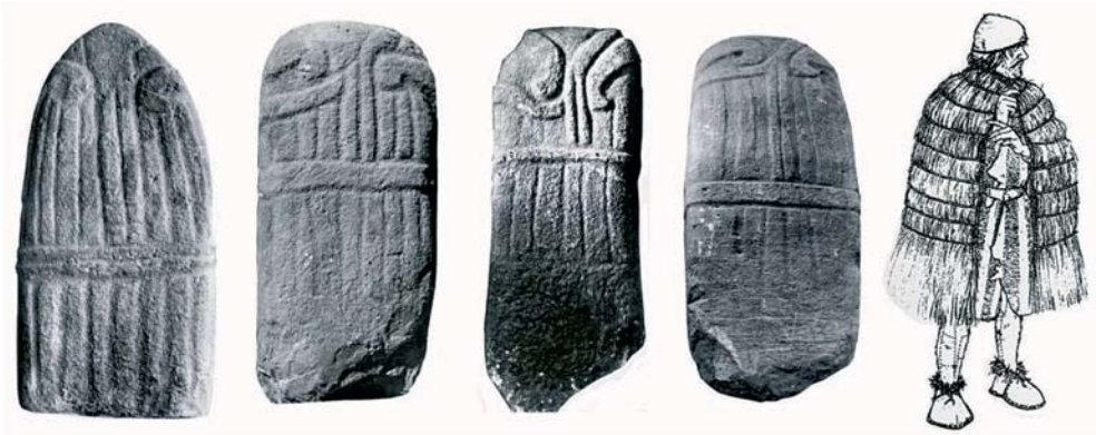
Figura 5. Estàtues-menhirs de la Rouergue, fotografies de la part posterior (d'esquerra a dreta): Saint Sernin, Saint-Maurice-d'Orient, Puedh Real i La Jasse du Terral I (SERRES 1997). A la dreta: restitució de l'home d'Otzi, l'home dels gels (disseny Welponer/STMA, dins PHILIPPON 2002).