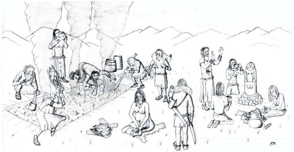
Figura 8. Dibuix idealitzat del jaciment de Ca l'Estrada (Canovelles, Vallès Oriental) amb les estructures de combustió i l'estàtua-menhir descoberta en les excavacions de la campanya 2004-2005.

França) i també algunes d'aquestes figures localitzades i conservades in situ, que es poden veure avui en dia prop de Saint-Pons-de-Thomières (Hérault, França), a unes 3 hores i mitja en cotxe des de Barcelona.