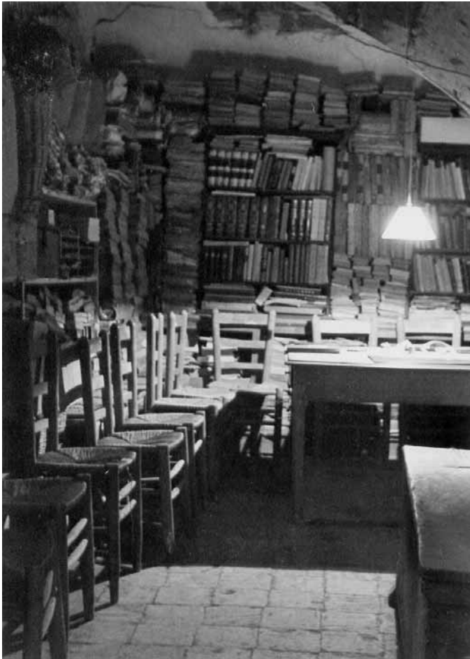
Sala de l'Arxiu just acabada la guerra civil.

tar fàcilment per l'entusiasme, un moianèsisme exagerat i un gran fervor religiós; per això a vegades fantasejava amb la història i, per dir-ho planerament, a vegades veia miracles on no existien. Cal afegir-hi que per la seva formació quedava fora del seu abast la consulta de bona part dels fons documentals que ell va contribuir a salvar.