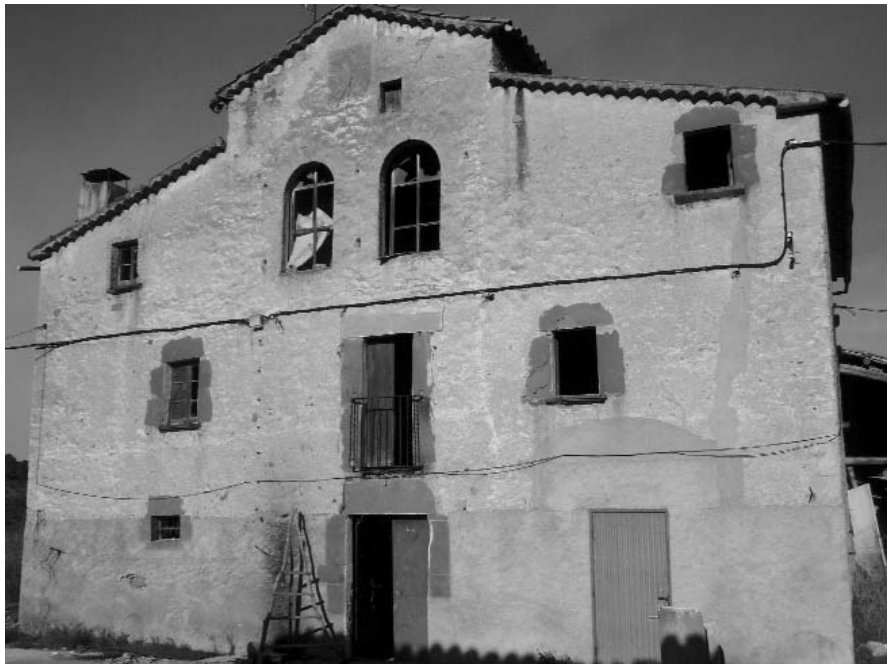
Masia de Can Cotis (Rellinars).

Can Cotis i les Farreres moren i s'ensorren davant d'uns Plans que no poden fer res sense l'ajut dels organismes oficials i sense la col·laboració de llurs propietaris. Com hem dit abans, no són casos aïllats al nostre territori però, tot i així, potser encara podem fer alguna cosa per salvar-les abans que sigui inevitable.