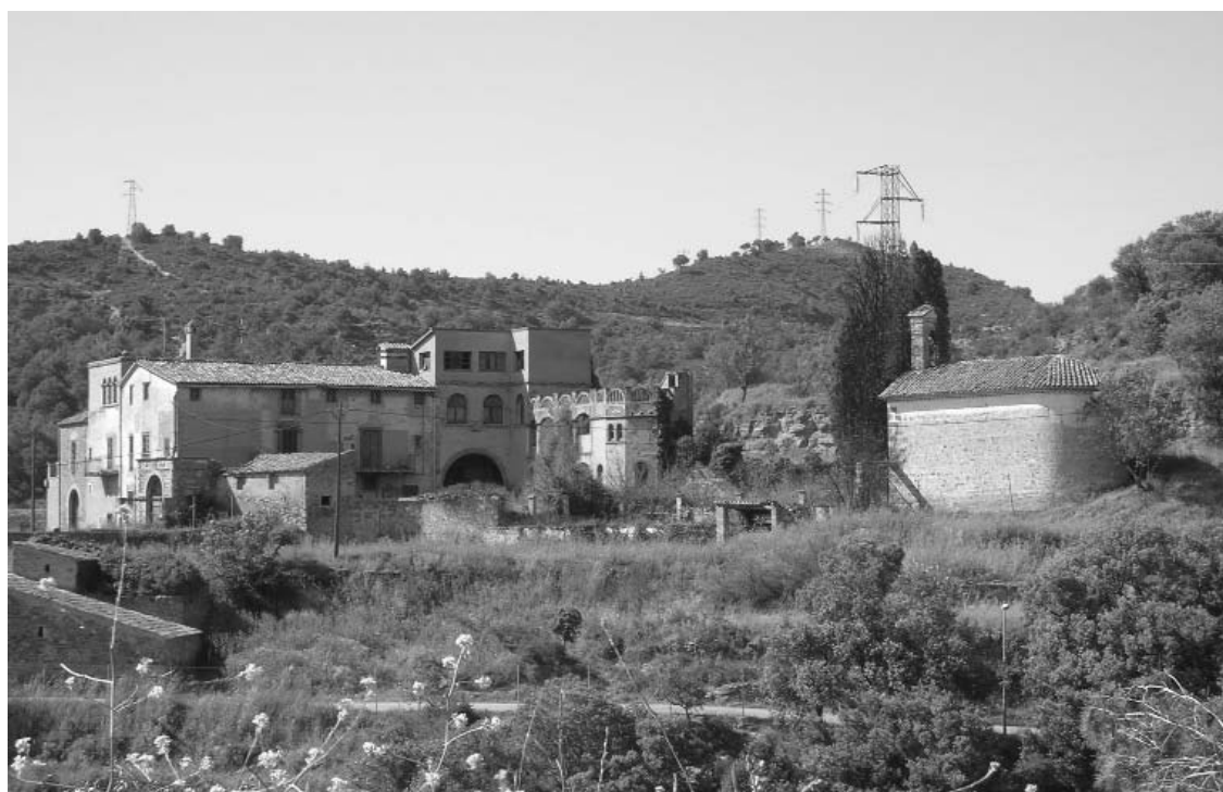
Mas de les Farreres i capella de Sant Felip Neri (Rellinars)