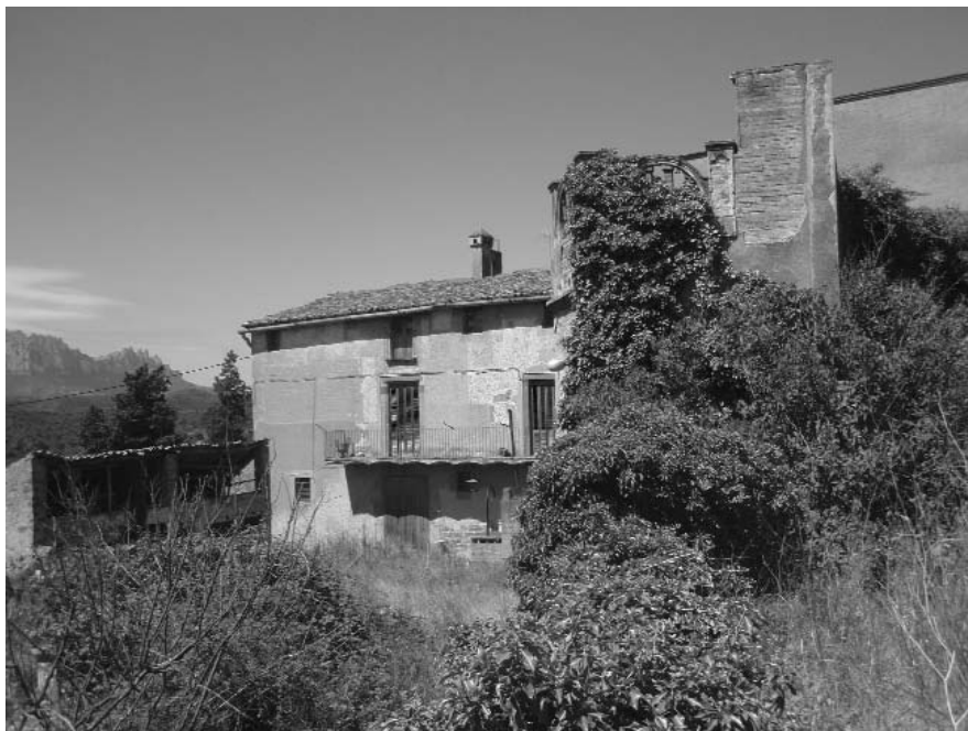
Vista de l'entrada del mas de les Farreres (Rellinars)

No tenim notícies d'alguns anys però coneixem dades disperses dels qui van ajudar a construir la casa que, amb ampliacions diverses i noves estades de masoveria, molí, etc., és la