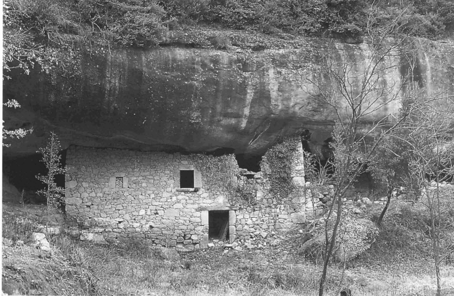
Antiga masoveria a la Bauma dels Racons (Lluçà).

de tots aquests inconvenients, l'opció que permet tirar endavant la viabilitat d'un projecte turístic arrelat al Lluçanès requereix grans dosis d'imaginació: l'aposta ha estat el turisme cultural, dedicat a la interpretació del paisatge a través del coneixement del passat.