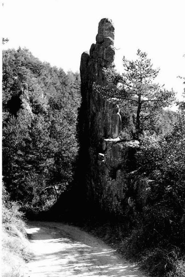
La Roca de Pena (Alpens), un dels passatges "màgics" més característics del Lluçanès.

El món medieval constitueix una altra de les rutes en perspectiva. El plantejament interpretatiu consisteix a