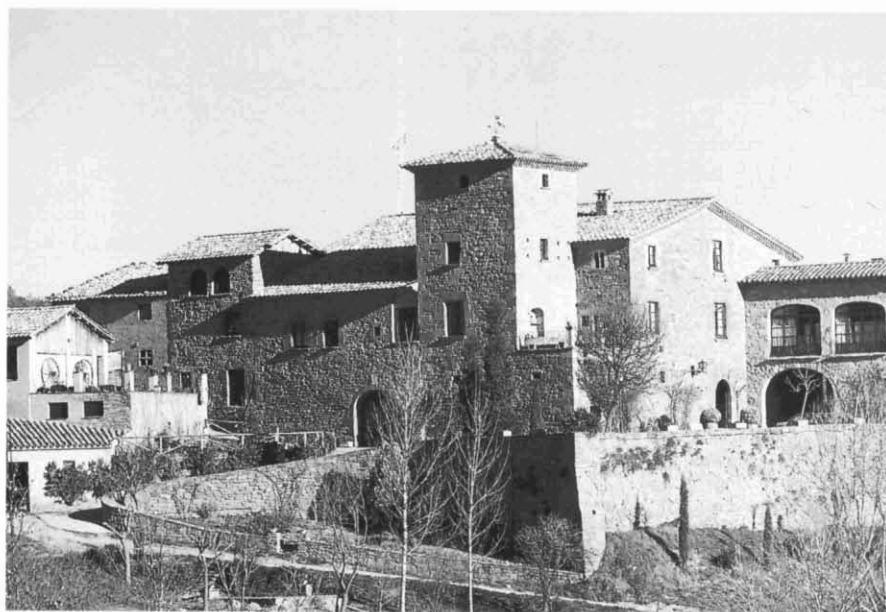
La gran masia de Pere Riera, amb la seva torre defensiva (Sant Bartomeu del Grau).

Fa un any que l'empresa Serveis Culturals del Lluçanès va organitzar les primeres rutes per als caps de setmana, cosa que s'ha traduït, fins al moment present, en l'assistència de més de tres-centes persones, procedents en la seva major part de Barcelona i de la seva àrea metropolitana. Els primers itineraris s'han englobat en l'anomenada "ruta de les bruixes", que ha desvetllat un notable interès en els assistents, tant des del punt de vista històric com cultural. L'argumentació històrica del fenomen