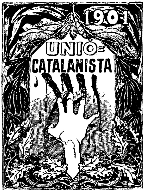
Segells de propaganda editats per la Unió Catalanista.