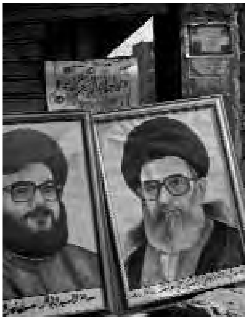
Beirut, agost 2006

Una de les continuïtats més dramàtiques és el manteniment de conflictes oberts o latents en diferents indrets de la Mediterrània. El més significatiu és l'israelo-palestí que més enllà de les repercussions que té per als ciutadans de tots dos països, contamina qualsevol projecte per aconseguir majors quotes d'integració política, econòmica i social a la Mediterrània. Els anys noranta, amb la conferència de pau de Madrid (1991) i els Acords d'Oslo (1993), s'obrí una finestra a l'esperança, tancada, al tombant de segle, amb la segona intifada. L'any 2005 diferents factors feien albirar una nova etapa d'esperança: la inicial retirada israeliana de Gaza, l'elecció de Mahmud Abbas i iniciatives com els Acords de Ginebra promoguts per membres de la societat civil palestina i israeliana. Un cop més, però, aquestes