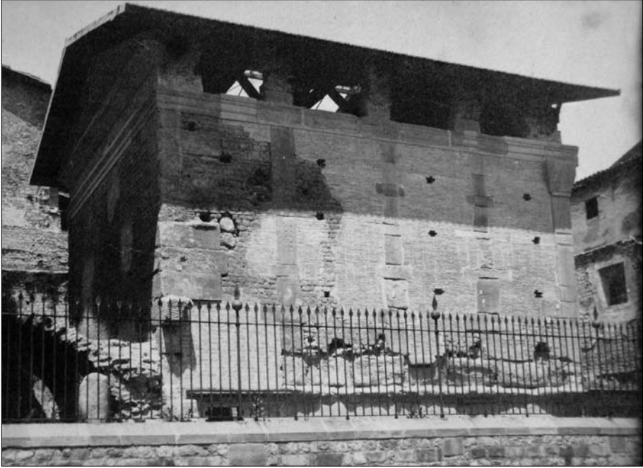
El temple romà abans de les actuacions del Patronat.