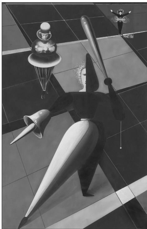
IMAGEN 8. Oskar Schlemmer, boceto para El ballet triádico , ca. 1924, gouache, tinta y collage sobre papel, 57,5 x 37 cm., MoMA, New York.

El cuerpo extático de la bailarina del cartel cuyos miembros se proyectan en el espacio infinito parece haber sido dibujado expresamente para negar esta separación entre lo funcional y lo lúdico, y afirmar a la inversa, un libre movimiento de los cuerpos libres homólogo al movimiento de las máquinas. Pero en ese caso es la película la que se convierte en una prueba para verificar esta adecuación. Sabemos que la película de Vertov se presenta como la aplicación radical de lo que en su cartel se anuncia: la manifestación de un arte totalmente convertido en vida y acción. No hay representación, solamente acciones, esas acciones que se realizan todos los días en las casas, las calles, las fábricas, las tiendas, los estadios o los clubs obreros. Pero la película no es una narración de estas acciones. Es la acción de coordinarlas, de materializar el vínculo de todas estas acciones organizándolas en una cosa-película que es ella misma una producción entre todas las producciones que construyen la nueva vida. Su operación principal consiste en igualar todas las acciones: al fragmentarlas en fragmentos cortos y al montarlas con un ritmo sincrónico