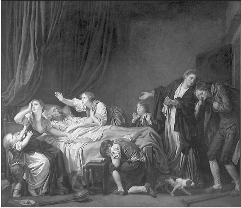
IMAGEN 3. Jean Baptiste Greuze, El hijo castigado , óleo sobre lienzo, 130 x 163 cm., Louvre, 1778.

que pueden desfilar en un desfile del Primero de Mayo, sino a un cuerpo dismantelado como los que representan los pintores cubistas o surrealistas. En general, esta es la razón por la que la destrucción del orden representativo no puede realizarse mediante un simple suplemento de acción y de expresión. Para ello, es necesario que los efectos de esta «activación» se combinen con los de un movimiento exactamente inverso: una pausa del movimiento y una ausencia de expresión.