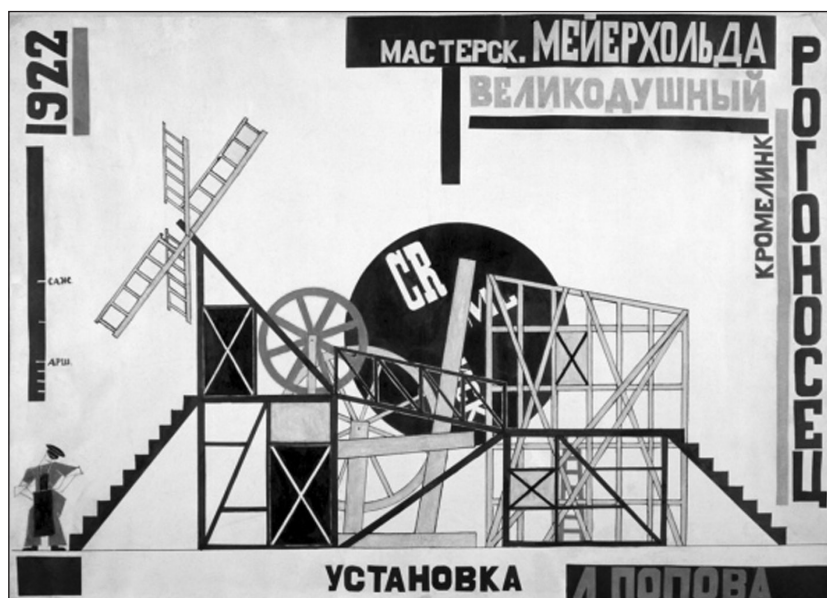
IMAGEN 5. Liubov Popova, cartel para El magnífico cornudo de F. Crommelynk, 1922; acuarela, gouache y collage sobre papel 50 x 69 cms. Galería Tetriakov. Moscú.

Observemos por ejemplo este dispositivo escénico concebido por Liubov Popova para la puesta en escena de «El Magnífico Cornudo» [IMAGEN 5]. Lo que este dispositivo ofrece a los actores no es el equivalente de la cadena taylorista. Es una máquina de juegos con sus escaleras, sus aparatos de gimnasia y toboganes que les permitirá transformarse ellos en gimnastas y transformar una comedia de costumbres burguesa en una serie de ejercicios acrobáticos y burlescos. Entre el sueño artístico-político de la acción directa sustituyendo a la vieja lógica representativa, y el sueño socialista taylorista, la coincidencia tan sólo es aparente: bajo el filtro de la racionalización taylorista, el modelo de la nueva actuación teatral no es el del obrero adaptado a su máquina, es el del acróbata que no se preocupa por nada ajeno a su actuación. O bien es el nuevo mimo, no el mimo expresivo soñado por Diderot sino el nuevo mimo mecánico, aquel cuyos gestos no imitan la eficacia de las máquinas sino su movimiento automático y repetitivo. Mirando el cartel en donde los miembros de la bailarina se transforman en hélice de avión, recordamos otra serie de dibujos soviéticos consagrada al mimo mecánico por excelencia, el que los artistas de la vanguardia soviética toman siempre como modelo, Charlie Chaplin. En dicha serie de dibujos realizada para el periódico Kino-Phot por Varvara Stepanova, vemos los gestos torpes del payaso de paso vacilante y a