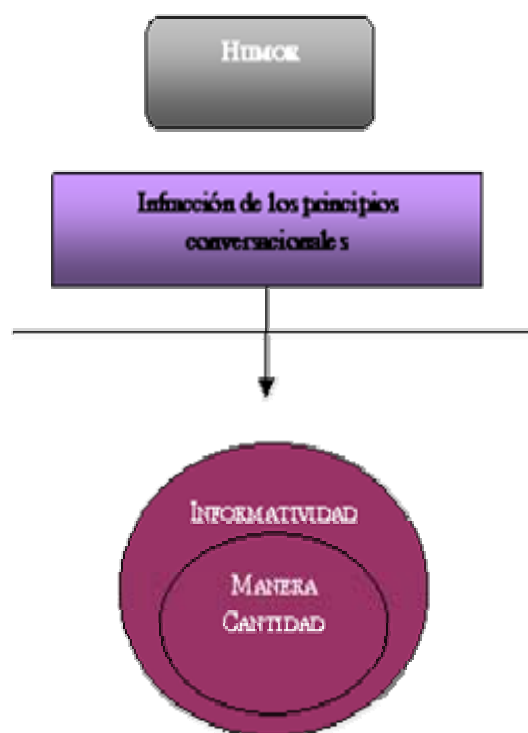
Figura 1: Infracción de los principios conversacionales en el humor

Como veremos, el principio de Informatividad, principio de refuerzo para Levinson (2000), se infringe de forma frecuente en el humor; las huellas de esta infracción son los indicadores que tienen que ver con las relaciones semánticas, como la polisemia, la ambigüedad, la homonimia, la paronimia, etc. El resto de principios quedan supeditados a la infracción de este principio, el de Informatividad, como se representa en la Figura 1: