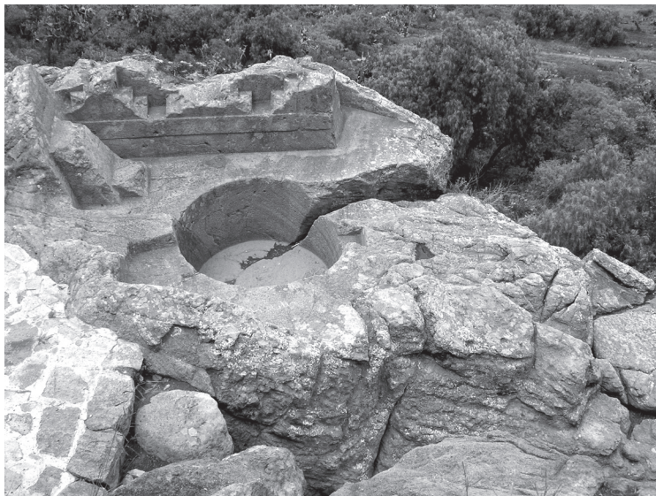
Figura 10: Los baños del Rey en el Cerro Tezcutzingo.

Es sabido que el Cerro Tezcutzingo poseía una clara dimensión simbólica como espacio ritual asociado al agua y la fertilidad 19 . Para algunos autores como Pasztory (1983 apud Espinosa 1996: 378-380), constituía un «sistema hidráulico en miniatura» que reproducía «flujos, las caídas y las lluvias de manera ingeniosa» y que usaba los estanques tallados en roca para representar ciudades –el Baño de la Reina (Figuras 8 y 9) era Tenayuca; el Baño del Rey (Figura 10), el lago de Texcoco, y un tercero, la vieja ciudad de Tula (Ixtililxóchitl 1952: 211; Espinosa 1996: 379)–. Para otros, como Heyden (1983), los jardines reunían las «plantas de los dioses», es decir, la vegetación de las divinidades acuáticas. Finalmente, otros autores asociaban el complejo con las deidades del agua y la vegetación, y consideraban los jardines consagrados a la pareja Tláloc-Chalchiuhtlicue (Musset 1992: 129). Para los nahuas de Texcoco, los arroyos albergan un mundo vegetal donde «todo verdura, todo verdura hay». «Ése lo sueñas y todo es puro jardín, todo. Sí, todo. Todo, todo, nopales... ¡Jardín!» Así, el palacio del Tezcutzingo resulta bastante coherente, en su totalidad, con la naturaleza y el talante del inframundo que representan los manantiales.