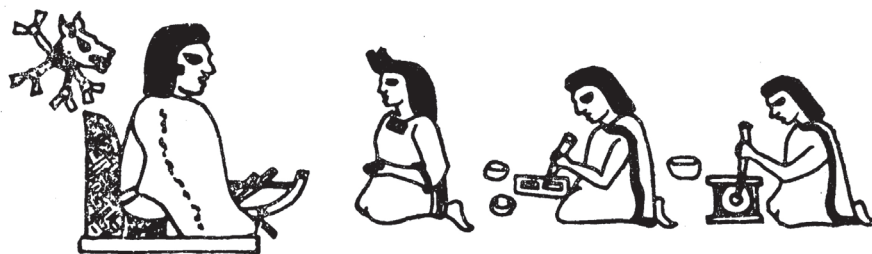
Figura 7: Nezahualcōyotl, la princesa Azcalxochitzin y dos escultores de Texcoco, según el Códice Tloltzin . Fuente: Martínez 2006.

Por su descripción y funciones, parece quedar fuera de duda que constituye una suerte de advocación de la divinidad prehispánica Chalchiuhtlicue en su versión de Xochiquetzal. En la mitología nahua Xochiquetzal, divinidad de las flores, la belleza y el amor, pero también del pulque, fue la primera esposa de Tláloc hasta que Tezcatlipoca se la robó. Entonces Tláloc contrajo nupcias con Chalchiuhtlicue, «la diosa del agua de las fuentes, los ríos y los lagos» (Broda 1971: 308-309, 260). Xochiquetzal estaba cercana a Chalchiuhtlicue, pues ambas se vinculaban con las deidades tlaloque 18 . En cuanto a «la pareja de Tláloc y Chalchiuhtlicue», se la concebía con frecuencia como una forma de expresar el desdoblamiento de la misma deidad que incluía la «separación del elemento masculino del femenino»: Tláloc representaba el masculino, el «agua celeste», mientras que Chalchiuhtlicue encarnaba el femenino, «los arroyos, ríos y lagos» (López Austin 2000: 178), algo que resulta muy adecuado a la pareja Nezahualcōyotl-Reina Xochitl (Figura 7).