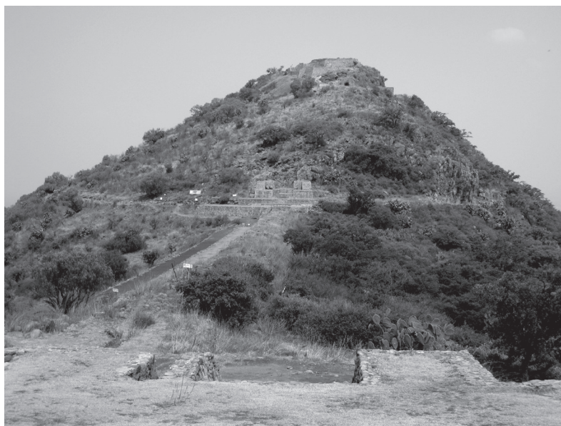
Figura 12: Vestigios del palacio del Tezcutzingo destruido y de los aposentos de la cima del Cerro.

Los nahuas destacan la estratificación social que rige el mundo del agua y que se expresa en este lugar de manera privilegiada; los ahuaques se distinguen por una serie de cargos y funciones. Contó una señora de su hijo, cuyo espíritu yacía apresado en el agua para que se «casara» con la Reina Xochitl: