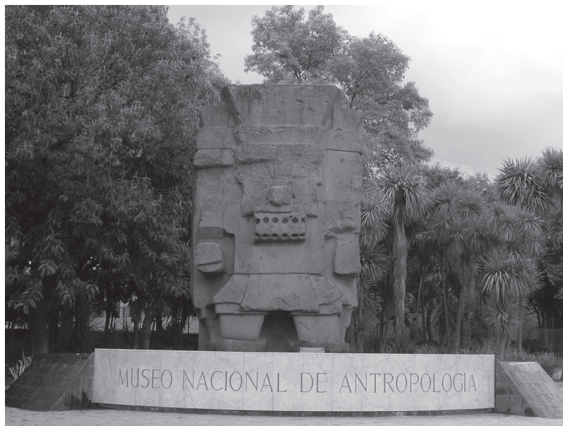
Figura 4: El molcajete de Nezahualcóyotl trasladado al Museo Nacional de Antropología.

Pero ahondemos en la idea de la piedra. La petrificación acosa a los dioses mesoamericanos que concluyen su trabajo. Pero no se trata del tránsito hacia un estado latente; siguen activos, ejercen poder 7 . Significativamente, en la iconografía mexicana el glifo para indicar la piedra era un «corazón» (López Austin 2000: 197). En el caso de Nezahualcóyotl, hay que añadir matices. No se habla de su origen aunque sí de sus trabajos en los primeros tiempos. En el mito no se nos dice más. ¿Cuándo y dónde surgió? No lo sabemos. La trama comienza in media res , con los dioses en el umbral de la competencia.