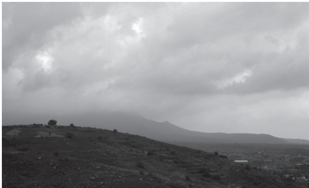
Figura 5: El Monte Tláloc en la estación húmeda, visto desde el Cerro Tezcutzingo.

A esa piedra se le hacen las peticiones regionales de lluvia. Como explicó don Cruz, hasta hace unos años existía en Amanalco una organización de pedidores de lluvia llamada «los hermanos espirituales». Estaba integrada por cinco o seis individuos y presidida por una anciana. Para pedir la lluvia todos acudían ante el tejolote : depositaban ofrendas y elevaban cánticos y alabanzas al monarca pluvial texcocano: