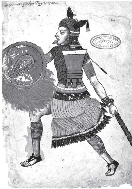
Figura 2: Nezahualcóyotl guerrero, según el Códice Ixtlixóchitl . (Fuente: Códice Ixtlixóchitl 1996: lámina 106r del facsímil).