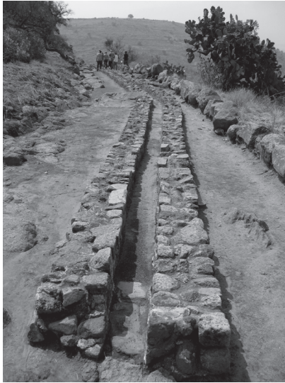
Figura 11: Canales del Tezcutzingo. (Fotografía del autor).

Los canales (Figura 11), cubiertos de obsidiana fina y brazaletes de jade y de oro 20 , alcanzaban casi el palacio, un complejo suntuoso con múltiples dependencias (Figura 12):