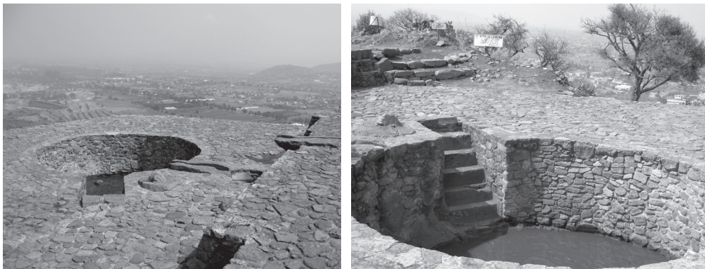
Figuras 8 y 9: Los Baños de la Reina en el Cerro Tezcutzingo.

Al comparar las descripciones del granicero con las clásicas y evocadoras descripciones de Fernando de Alva Ixtlilxóchitl, no dejan de surgir coincidencias. ¿Existe la posibilidad de que el referente histórico haya sido incluido en los mitos? Seguramente. ¿Un palacio, habitado por una reina, saturado de vegetación e inmerso en el agua? Las respuestas deben surgir, lógicamente, de una experiencia real de los nahuas.