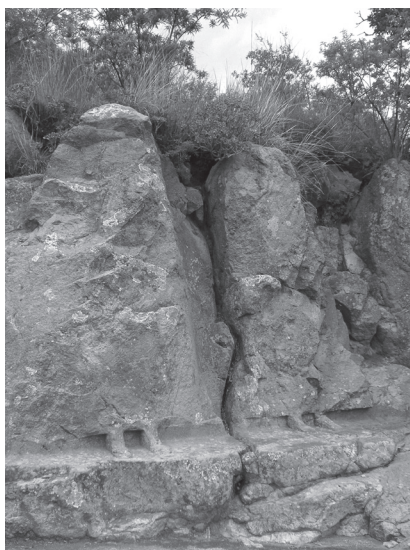
Figura 6: El Rey y la Reina del Tezcutzingo destruidos en la campaña serrana de extirpación de idolatrías.

Aunque el documento no hace a don Carlos responsable directo de estos actos, sino únicamente de los ídolos hallados en el jardín de su casa (la de Nezahualcóyotl), se trasluce que tanto el tribunal como los serranos los consideraban asociados a su abuelo y pertenecientes al mismo complejo.