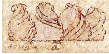
Figura 6: Tenayuca: (a) glifo tradicional muralla ( tenamitl ) Códice Mendoza , fol. 2r (1997); (b) muralla hecha con piedras (glifos tetl ), Mapa Quinatzin , fol. 3 (ms mex. 396 BNF)