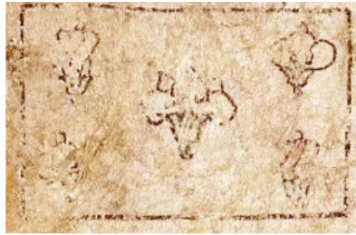
Figura 7: Xochimilco: (a) glifo tradicional campo ( milli ), Códice Mendoza , fol. 2v (1997); (b) campo delineado por un rectángulo, Mapa Quinatzin , lám. 3 (ms mex. 396, BNF)

la representación de esas piedras, singularizadas cada una a diferencia de las representaciones estereotipadas tradicionales (véase Códice Xólotl ) 42 .