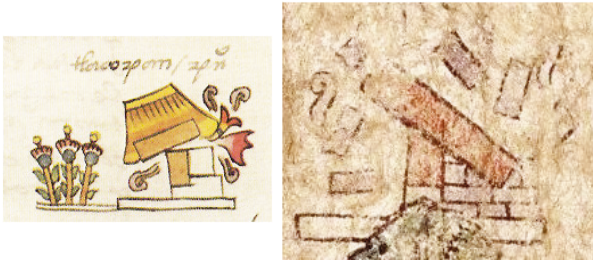
Figura 8: Pueblo conquistado: (a) templo quemado, Códice Mendoza , fol. 5v (1997); (b) Templo quemado y deruido con triple rango de ‘piedras’, Mapa Quinatzin , lám. 3 (ms. mex. 396, BNF)

Asimismo, las piedras constitutivas de la casa que horada el ladrón (q3_b_01) se representan sin recurrir a la convención tradicional. Si se tratase de adobes se podría entender, pero al ubicarse en la base 46 y representarse con formas varias, nos parece que el tlacuilo quiso indicar piedras de construcción dándoles un aspecto realista y no convencional.