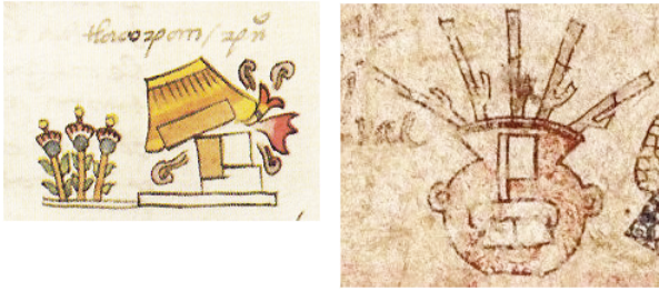
Figura 2: Tlacopan: (a) glifo tradicional ( tlacotl ), Códice Mendoza , fol. 5v (1997); (b) glifo tradicional y fonético ( tlantli, comitl, pantli = tla-co-pan), Mapa Quinatzin , lám. 3 (ms. mex. 396, BNF)