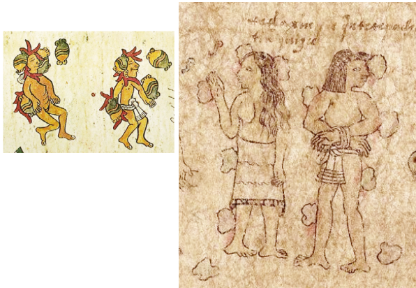
Figura 4: Lapidación de adúlteros: (a) Códice Borbónico , p. 12 (treceña de Iztlacoliuhqui): manchas de sangre delimitadas, glifo tetl para piedras, seno de perfil; (b) Mapa Quinatzin lam. 3 (ms mex. 396 BNF): manchas de sangre sin delineación previa, piedras 'naturales', seno de frente