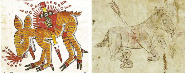
Figura 3: Ciervo herido: (a) Códice Borgia , p. 22: manchas de sangre con forma simbólica, pezuñas de triple color; (b) Mapa Quinatzin , lám. 1: manchas de sangre sin forma simbólica, pezuñas monocromáticas, error de perspectiva para el candil derecho