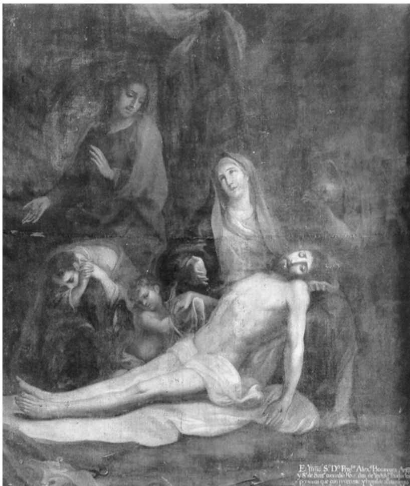
Fig. 3.- Lamentación por el Cristo muerto. Miguel Cabrera, 1740. Óleo sobre lienzo. Convento de San Juan del Poyo de Pontevedra.