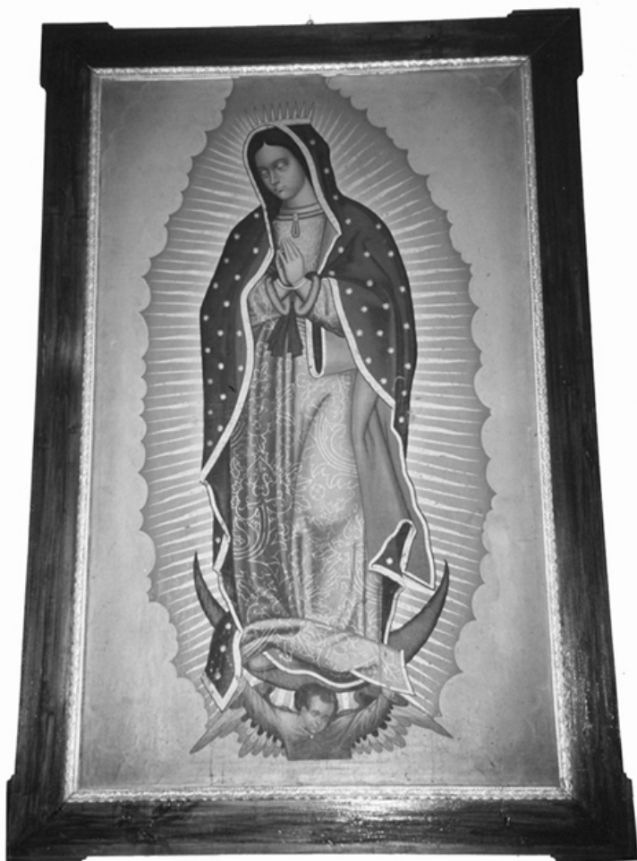
Fig. 1.- Virgen de Guadalupe . Anónimo. Siglo XVII. Óleo sobre lienzo. Iglesia del Convento de las Comendadoras de Santiago de Granada.