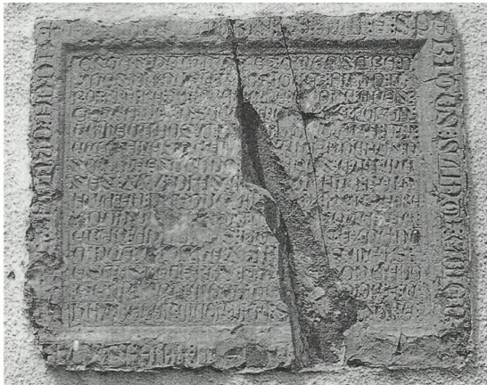
Fig. 2. Lápida dos pazos de Ferreira do Zêzere (Barroca 2000: 3, 491)

do Mestre de Cristo, Gonzalo Tenreiro 30 . Así pois, no primeiro caso, atina coa data exacta do inicio do seu mestrado (andados 4 anos, 7 meses e 26 días do 05/07/1362), como xa vimos, o 8 de novembro de 1357, pouco despois do entronizamento de Pedro I 31 .