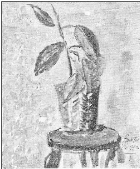
¿Onde se frota da invernia? (Dibuxo González Pastoriza e Ferrero)