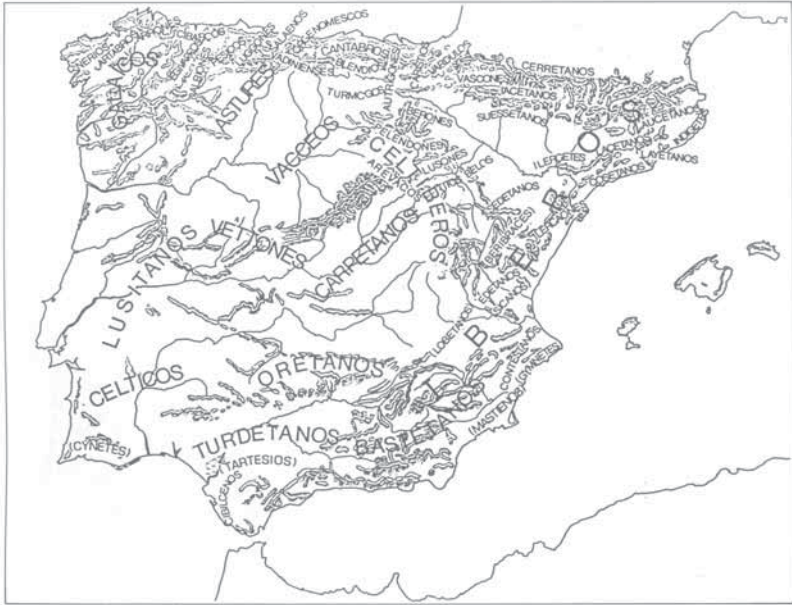
Fig. 6: Mapa paleoetnológico de la Península Ibérica según M. Almagro-Gorbea y G. Ruiz Zapatero (1992)