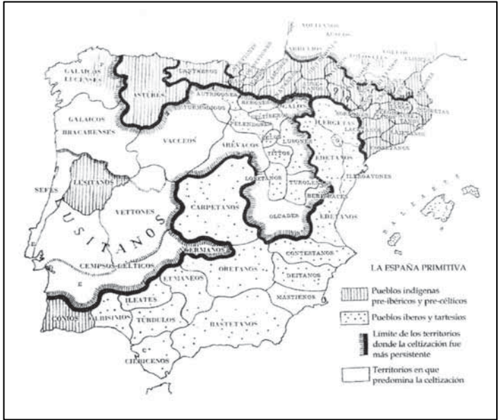
Fig. 3: Distribución de los pueblos primitivos de la Península Ibérica según P. Bosch Gimpera (1944, mapa VIII).