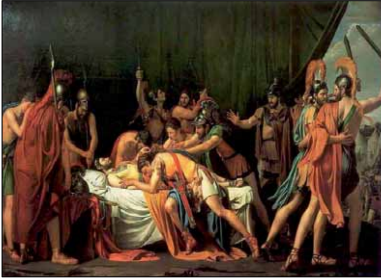
Fig. 1. "La muerte de Viriato", obra de José Madrazo y Agudo (1806-1807). Museo Nacional del Prado.