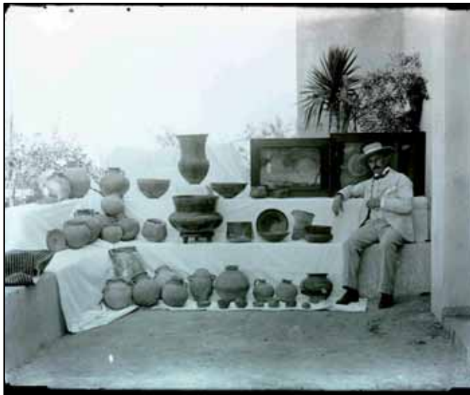
Fig. 2: Jorge Bonsor, posando junto a los materiales procedentes de sus excavaciones en la zona de Los Alcores.