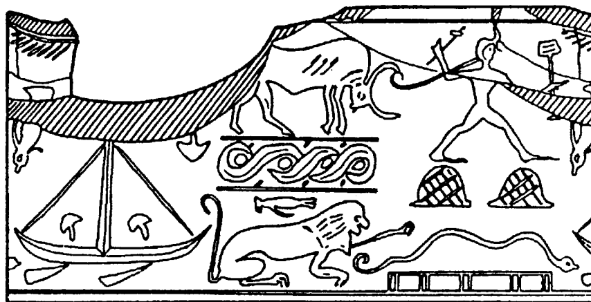
Figura 2: Impronta de un sello cilíndrico hallado en Tell el-Daba (Avaris).