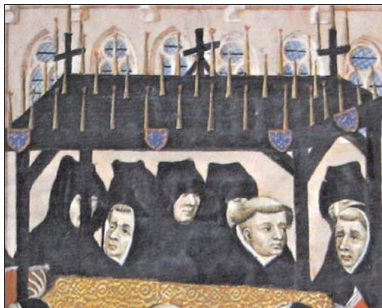
Fig. 12. Grandes Horas del Duque de Berry, f. 106.

los Funerales de Enrique V de Inglaterra, en un códice de Martial d'Auvergne de hacia 1484 95 . Debió ser muy frecuente esta práctica de pintar o bordar las armas del difunto en estos paños, exentas o sobre un escudo, teniendo en cuenta los numerosos testimonios documentales en los que se menciona esta practica; por ejemplo en las cuentas de Gonzalo de Baeza, tesorero de Isabel la Católica de 1477-91 donde se dice: