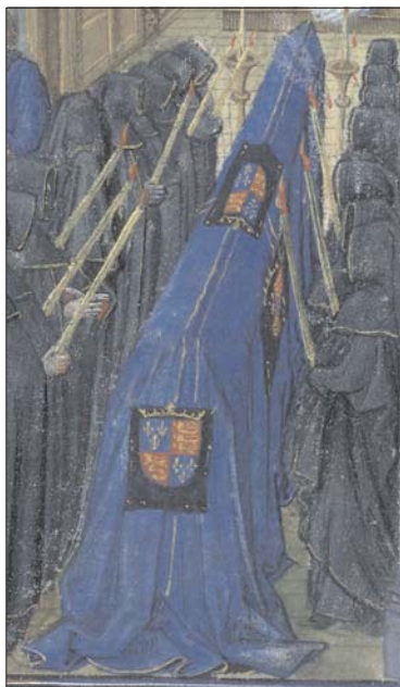
Fig. 15. Grande Chronique de Normandie , f.176.

108 CARRIAZO RUBIO, Juan Luis: ob. cit. , p. 323.