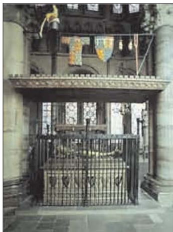
Fig. 16. Tumba del Príncipe Negro, capilla de la Trinidad,

Una de las escasas tumbas que ha mantenido esta escenografía caballeresca es la sepultura de Eduardo de Woodstock, Príncipe Negro de Gales († 1376), en la capilla de la Trinidad de la catedral de Canterbury, mantenida como preciado testimonio de esta costumbre en su contexto original 113 , colgando sobre su sepultura permanecen los atributos que lo identifican como caballero (escudo, yelmo etc.) 114 , y con las armas del Príncipe de Gales, que atestiguan y exhiben la posición del Príncipe Negro en el momento de su muerte (fig. 16).