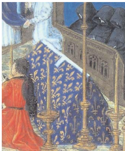
Fig. 14. Libro de Horas francés.

hacia 1460 98 (fig. 14); en las Crónicas de Girart de Rousillon 99 ; en los funerales de Felipe VI de Francia en las Crónicas de Jean Froissart 100 ; en una misa de difuntos de un libro de horas (1480) de la Pierpont Morgan Library 101 ; ó en los magníficos funerales de Guillermo el Conquistador en la Grande Chronique de Normandie de hacia 1465-68 102 (fig. 15).