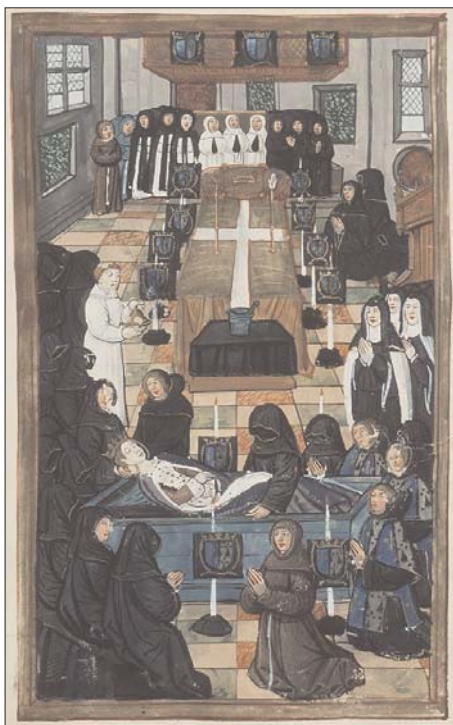
Fig. 1. Commemoration de la mort d'Anne, reine de France, duchesse de Bretagne , de Pierre Choque, f. 14v.

A este duelo de duración variable le seguía el cortejo fúnebre, procesión laica 38 formada (dependiendo del caso) por parientes, amigos, cofrades, clérigos, frailes o vasallos, en la que se exhibían las pertenencias y atributos sociales del finado 39 ; todo ello en medio de un ensordecedor coro de lamentos, tremendas y drásticas muestras de duelo en las que los partici-