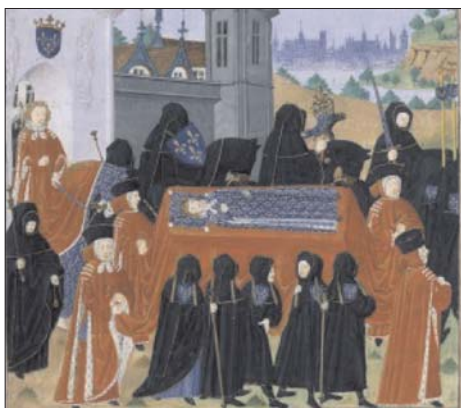
Fig. 4. Cronicas de Jean Chartier , f. I.

Otra costumbre notable en los duelos fúnebres era la ceremonia caballeresca de correr las armas , muy difundida entre la nobleza aragonesa 71 , que