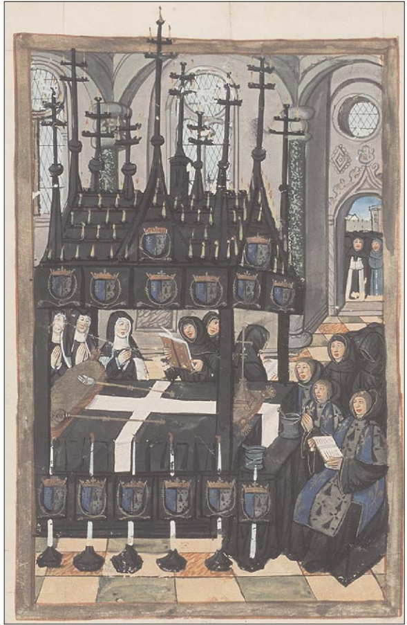
Fig. 10. Commemoration de la mort d'Anne, reine de France ... , f. 24v.

También es muy notable la presencia de emblemas heráldicos en los ricos paños mortuarios (llamados también en los textos, alhombros y reposteros ) que cubren el ataúd desde el cortejo hasta el sepulcro, y en los que se bordaban escudos con las armas correspondientes, tal como aparece en