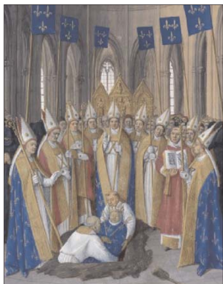
Fig. 8. Grandes Crónicas de Francia , f. 323.