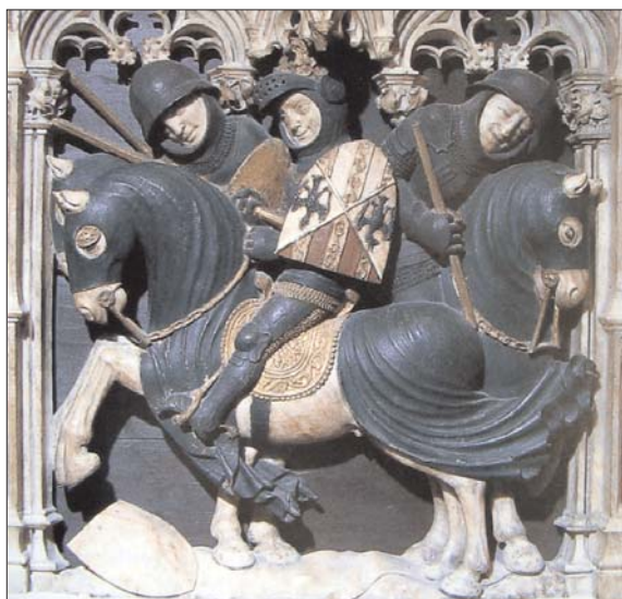
Fig. 7. Panel del sepulcro de Fernando de Antequera.

De nuevo, este ceremonial castellano parece pobre y austero en contraste con el exquisito y complicado rito borgoñón del siglo XV, en el que queda patente la función de estas ceremonias como exhibición de poder, prestigio y