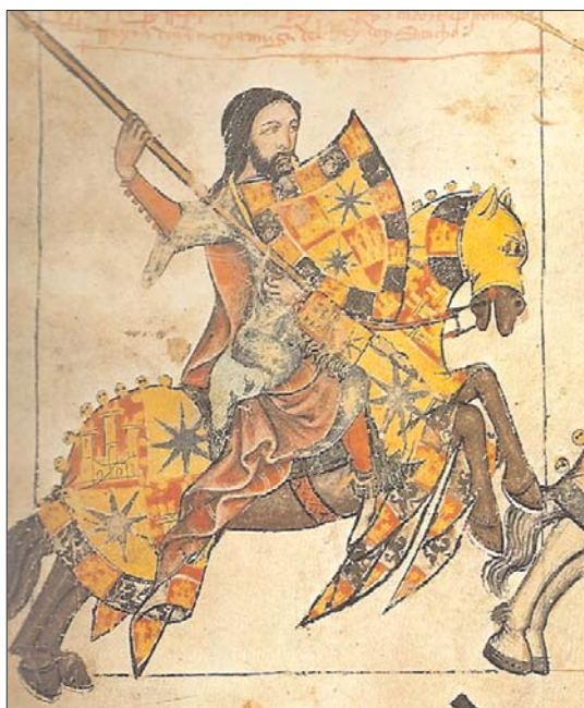
Fig. 6. Libro de la Cofradía de Santiago de Burgos.