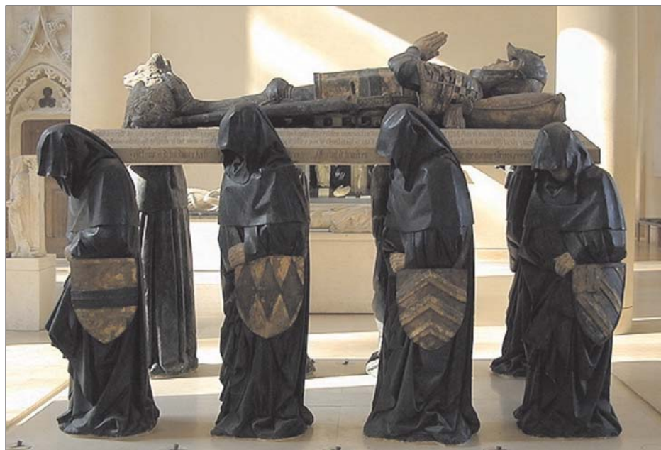
Fig. 5. Tumba de Philippe Pot.