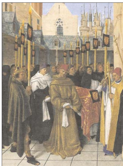
Fig. 3. Horas de Etienne Chevalier , St. 38.

tados del reino, y en su defecto de la ciudad en la que se celebraban los funerales; en ellos se gastaba ingentes cantidades de dinero para enlutar con paños, cirios y hachas el itinerario que seguía el cortejo, incluida la casa o palacio donde se velaba el muerto y el templo donde era inhumado, todo ello cargado con escudos de armas del difunto, acompañados frecuentemente por las armerías de otras casas con las que el personaje mantuviera alianzas o estuviera emparentado 59 .