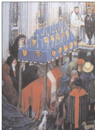
Fig. 11. Misal de Turín-Milan, f. 116.