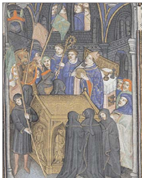
Fig. 2. Libro de Horas, sur de Francia, fol. 91r.