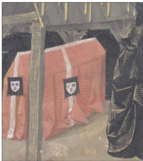
Fig. 13. Manuscrito f. 27v.