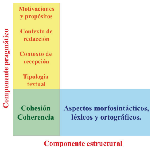
Figura 1. Elementos de la LE en la escritura.

componente pragmático, como puede observarse en la figura de la página siguiente: