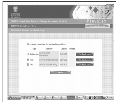
Gráfico 5. Pantalla de transición entre secciones

donar. Como se ve en el diagrama 5, todo ello queda recogido en una sola pantalla y es bastante claro. Además, cada botón tiene un color claramente distintivo que permiten que incluso los alumnos con más dificultades encuentren una pantalla fácil de seguir y en la que se reconocen mecanismos como cierre, comienzo, tiempos y otras necesidades de manera muy sencilla.