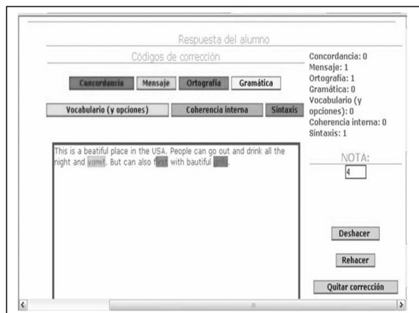
Gráfico 7. Backoffice de la sección escrita

Aunque, en este caso, el estudio inicial había planteado un sistema de baremación automática con una validación del profesor, finalmente se optó por un sistema