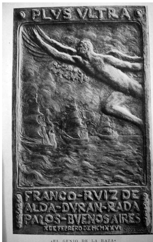
FIGURA 4: Placa conmemorativa “El Genio de la Raza” [ Raza Española , Madrid, n° 85-86, enero-febrero de 1926, p. 9 - AECl].