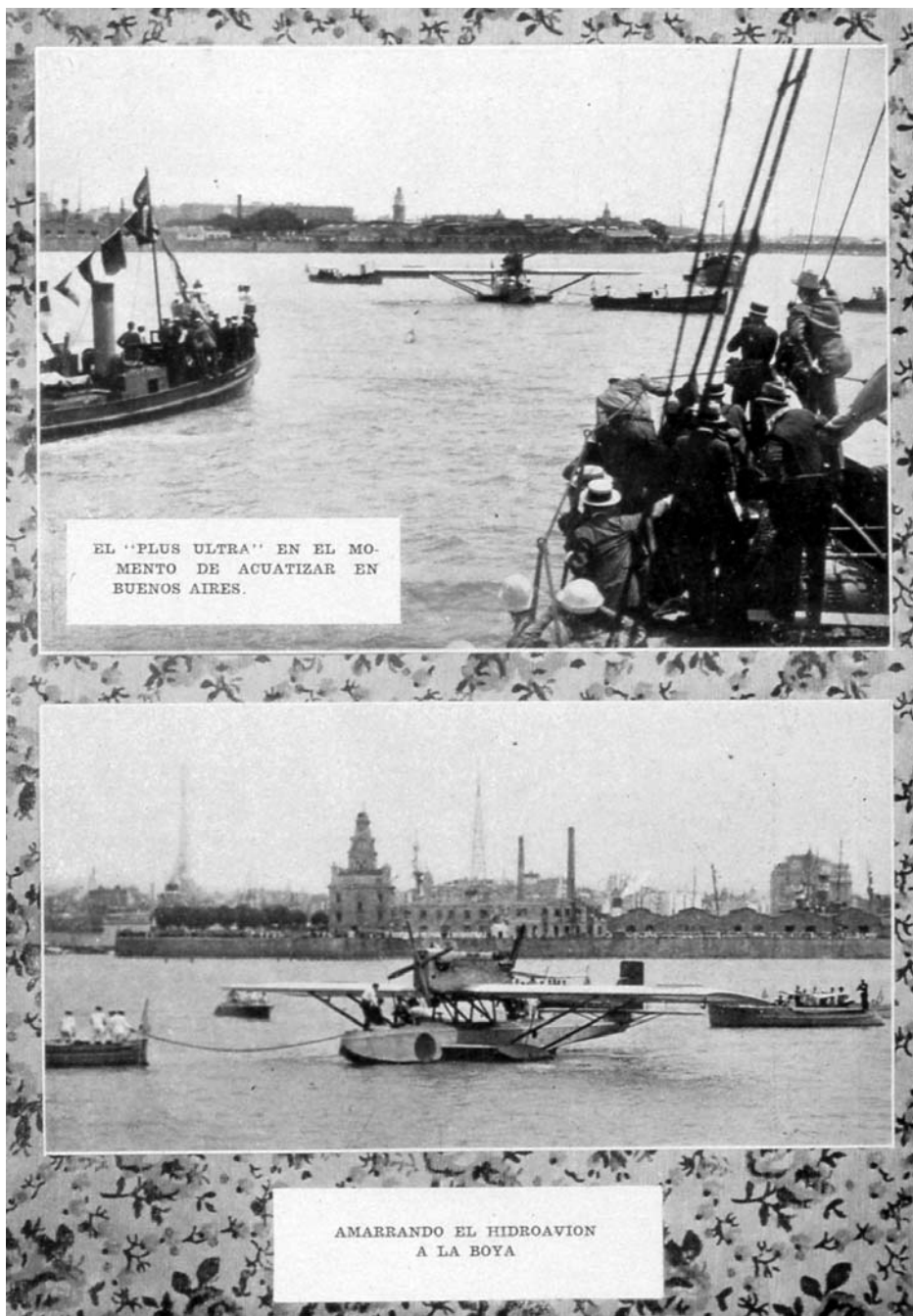
FIGURA 2: "El Plus Ultra en el momento de acuatizar sobre Buenos Aires" [ Album gráfico. Homenaje a los héroes del "Plus Ultra" , Buenos Aires, La Cooperativa Fotográfica, 1926, p. 20 - BNE].