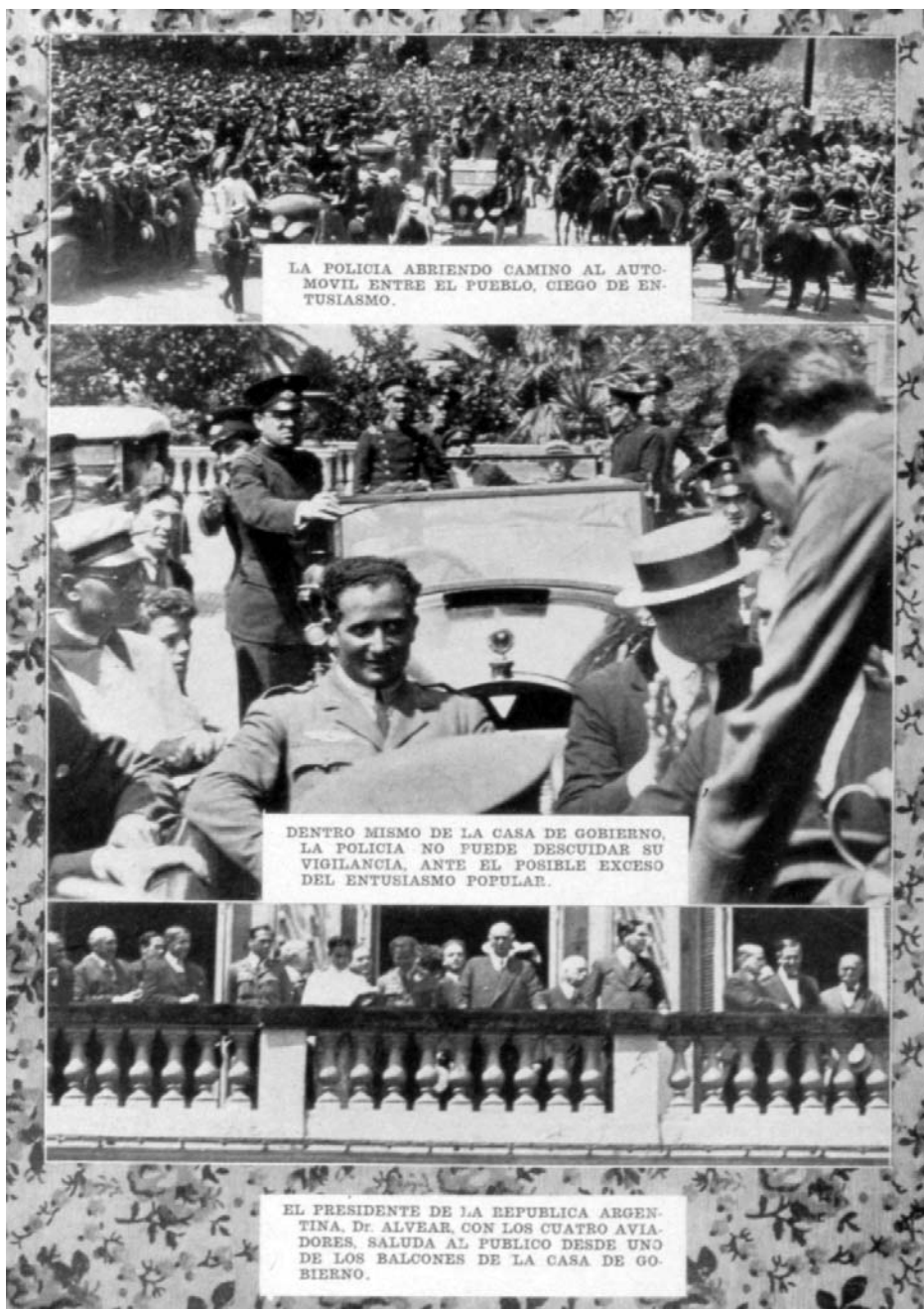
FIGURA 3: “La policía bonaerense abriendo camino al auto en su camino hacia la Casa de Gobierno- El Presidente argentino, M.T. Alvear, y Franco saludan a la muchedumbre desde la Casa del Gobierno” [Album gráfico. Homenaje a los héroes del “Plus Ultra”, Buenos Aires, La Cooperativa Fotográfica, 1926, p. 41 - BNE].