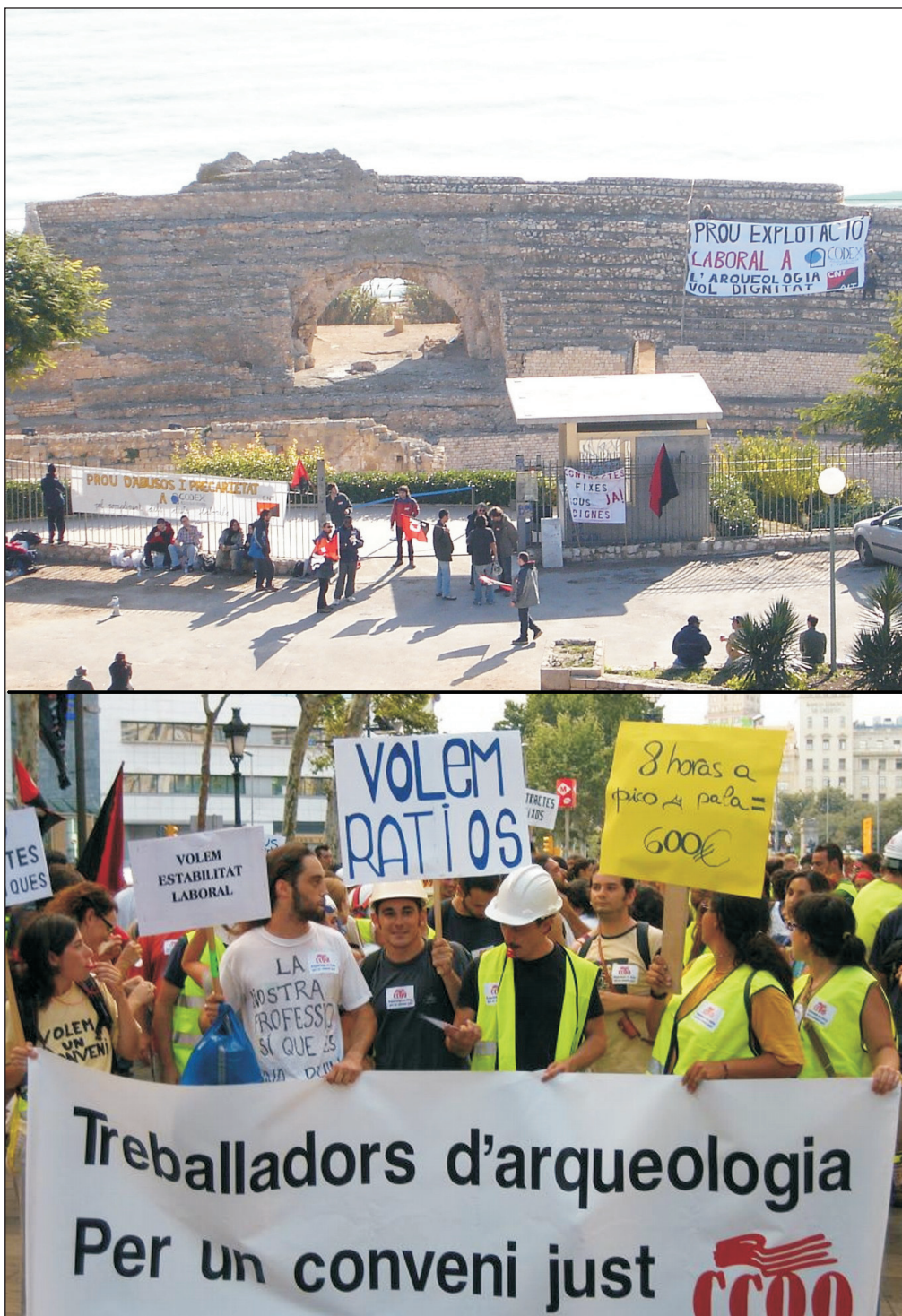
Figura 4.- Ocupación simbólica del teatro romano de Tarragona durante la manifestación del 16 de diciembre de 2006 por parte de los trabajadores de la sección sindical de la CNT en Codex, la mayor empresa de arqueología catalana del momento. Debajo, manifestación por las calles de Barcelona contra la precariedad laboral durante el verano anterior, el 17 de julio de 2006.