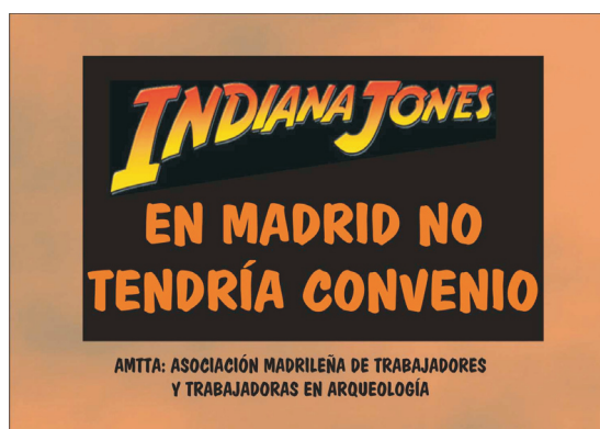
Figura 2.- Pegatina reivindicativa mostrada con motivo de la manifestación de la Asociación Madrileña de Trabajadores y Trabajadoras en Arqueología (AMTTA) frente a los cines de la capital que estrenaban la película “Indiana Jones y el reino de la calavera de cristal”, 22 de mayo de 2008. Diseño: AMTTA, 2008.

Otro ámbito arqueológico donde se aprecia este nefasto fenómeno es la difusión del Patrimonio. Si por una parte crece el interés de la sociedad, los recursos y las actividades disponibles (Maury y Rieu 1999; Tresserras y Matamala 2005; Rello y Morín 2007; Martín y Cuartero 2008), por la otra no se puede o no se quiere solventar la dependencia política desde la propia disciplina. Esto es, con relativa frecuencia se consolidan yacimientos y se crean rutas ficticias sujetas a las demarcaciones e intereses de los promotores, ya sean ayuntamientos, provincias o mancomunidades. Por ejemplo, en los casos en los que se ha podido estudiar la trayectoria de éstos y de otros grupos de acción local que gestionan los importantes fondos europeos (Moya 2007: 224) se pone de manifiesto que el producto cultural que se divulga queda supeditado a intereses partidistas y económicos antes que a criterios meramente didácticos y coherentes con el discurso histórico.