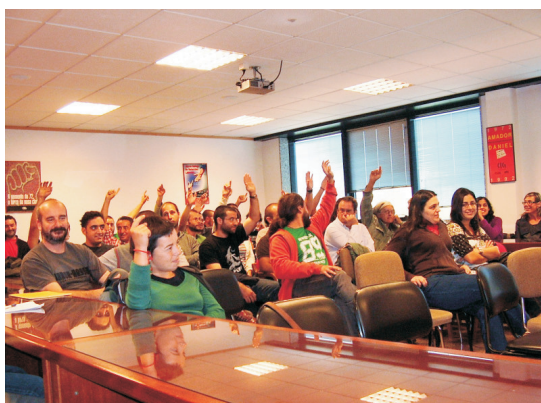
Figura 3.- Votación en 2007 del borrador del primer convenio colectivo de arqueología de Galicia en la sede de la Confederación Intersindical Galega (CIG). El convenio fue firmado en marzo de 2009 con la Asociación Empresarial Galega de Arqueoloxía (AEGA) y publicado oficialmente en junio.

Ante situaciones similares, el presidente de la Federación Nacional de Asociaciones de Trabajadores Autónomos (Amor 2008) señala que esta realidad puede normalizarse incluso con denuncias de