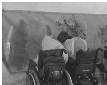
Usuarios del taller de arteterapia del centro Dato II de Madrid

Espasticidad significa rigidez; las personas que tienen esta clase de parálisis cerebral encuentran mucha dificultad para controlar algunos o todos sus músculos, que tienden a estirarse y debilitarse, y que a menudo son los que sostienen sus brazos, sus piernas o su cabeza. La parálisis cerebral espástica se produce normalmente cuando las células nerviosas de la capa externa del cerebro o corteza, no funcionan correctamente.