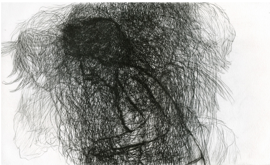
Figura 4. Cheryl Donegan, Kiss my Royal Irish Ass (K.M.R.I.A.) 1992. Fotograma del vídeo de la performance realizada en la Andrea Rosen Gallery, New York.

En segundo lugar, de naturaleza más traumática son las heridas y marcas en el cuerpo que dejan su impronta en el papel. Un ejemplo es la obra Trademarks de Vito Acconci quien en 1971 se sentó delante de una cámara para morderse el cuerpo, entintar esas huellas y obtener una estampa.