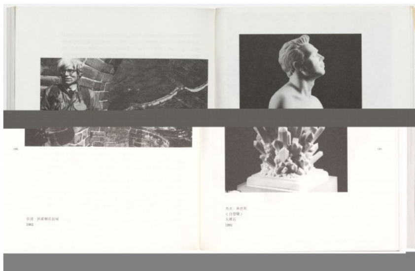
Figura 2. Ai Weiwei, The Black Cover Book , 1994, Libro de artista. Edita: Tai Tei Publishing Company Limited, Hong Kong. Estampador: desconocido, Hong Kong. Edición: 3,000. The Museum of Modern Art, New York.

Por último, al disminuir el proceso artesanal el artista se concentra en un plano más intelectual y comienza a insistir en el poder reivindicativo del arte gráfico más que a su orientación estética. Brea precisa en sus ensayos que lo que está en juego es la forma de abordaje a las prácticas de producción de significado y efectos culturales, haciendo una interesante propuesta de fusión entre disciplinas: