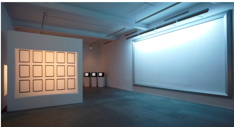
Figura 1. Exposición 2011.

A.M.>Sí, y a que se sitúen. Es la audiencia la que, al situarse en ese “entre”, lo cambia, lo desplaza. Al percibirlo, puede entenderlo críticamente o puede compartir mi posición, pero en cualquier caso esas estructuras de interpretación son cambiables. No quiero entrar en la idea de la “obra abierta”, pero es cierto que la interpretación implica unos grados de percepción y de información. Los receptores detectan cosas. Unas les interesan más que otras, según puedan asociarlas (por los grados de información de que dispongan) a algo que habían pensado antes. O bien les hacen pensar algo nuevo. La activación es, para mí, fundamental, y de ahí que acuñara la frase Warning: perception requires involment [Atención: la percepción requiere compromiso]. Entrar en una obra es un trabajo que pide involucración. Las estructuras políticas, económicas, sociales... hacen que desarrollemos cierta capacidad de percepción de cosas que no están ni catalogadas ni definidas según los términos estéticos existentes -“belleza”, “arte”...-, pero que son evidentes.