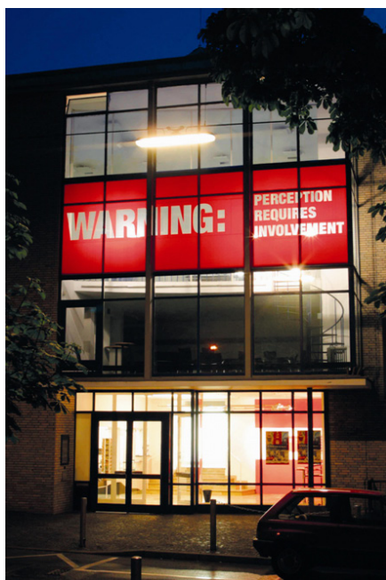
Figura 2. On Translation: Warning... 1999- (Archivo personal del artista. Sascha Dressler, 2003).

J.> En los últimos años se ha establecido una contraposición entre un arte que, según Jacques Rancière, busca generar comunidades disensuales opuestas al orden establecido, y ese otro “arte relacional” del que habla Nicolas Bourriaud, que fomenta nuevos vínculos entre los receptores. Es curioso comprobar cómo en los años 70, en trabajos como Cadaqués – Canal Local [1974] o Barcelona Distrito Uno [1976], anticipaste algunos aspectos que veinte años más tarde reaparecerán en el contexto de esta polémica. ¿Detrás de la idea de trabajar con los receptores en grupo había una voluntad de crear comunidades o fomentar relaciones?