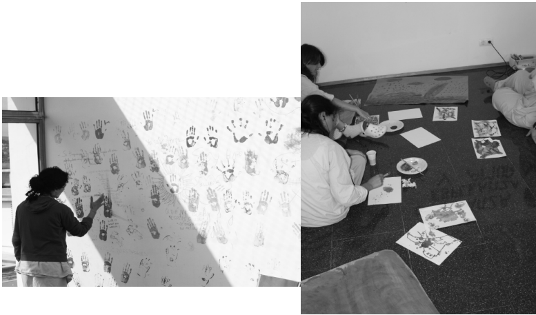
Fig.8 y 9 Talleres de arteterapia en el área de psiquiatría