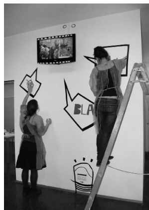
Fig. 7 y 8. Colectivo VIRA-LATA trabajando en su ARTE EN VIVO en la sala de Hemodiálisis.