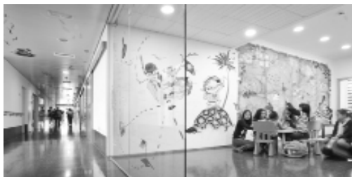
Fig. 4. Pasillo y sala de juegos de pediatría. XLF Crew