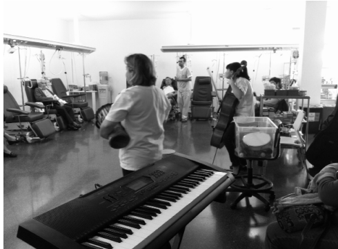
Fig.10. Taller de musicoterapia en el Hospital de Día

Según los datos obtenidos hasta la fecha, se atienden a una media de 25 pacientes semanalmente.