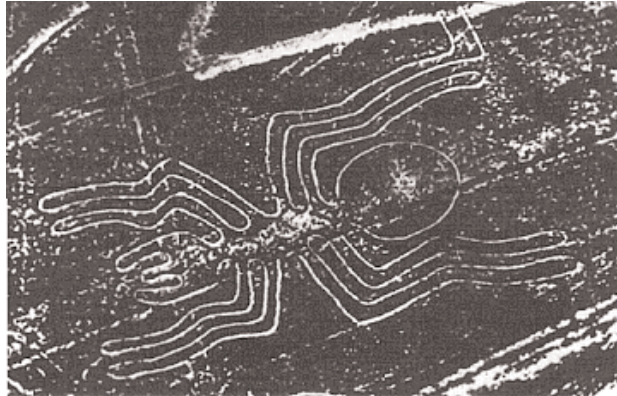
Líneas de Nasca: La araña

Con 46 m de largo, se ubica entre una red de líneas rectas y es parte del borde de un enorme trapecoide