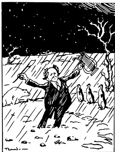
El Poeta: ¡¡Ob. la Primavera!!

dencia que el Gran Cauca tuvo de la agricultura y la minería, bastión del esclavismo. En 1930 el poeta volverá a insistir retóricamente en que la explotación de una raza por otra es cosa del pasado y en que la dignificación de los dos contingentes subalternos fue una prioridad para Bolívar: «¿Quién polarizó los anhelos de tres razas haciéndolas olvidar el pasado sangriento, reconciliándolas para siempre sobre el regazo de la igualdad?» (1973-1974: 1. 54) 12 . Desde luego, ver a las tres razas en igual situación de esclavitud bajo la colonia es menos grave que situarlas, en el momento presente, en una igualdad ficticia. Así captó Rendón el divorcio de realidad político-social y fantasía eglógica en la escritura valenciana: