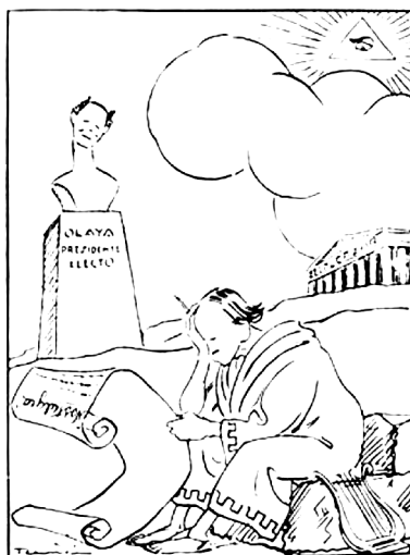
Figuras 4 y 5: Valencia dando la espalda a la realidad inmediata, tanto en el canto de lo exótico y ausente (4) como en la «Nostalgia» del bucolismo greco-latino que sucede a la derrota electoral (5)

El acontecimiento social más sobresaliente en el departamento del Cauca en el período que hemos llamado de «transición» a la modernidad lo constituyeron las agitaciones indígenas, lideradas por otro payanés de Belalcázar: el indio páez Manuel Quintín Lame, verdadera antítesis estamental del poeta. Lame se enfrentó a la clase terrateniente de Popayán (encabezada por Valencia en la Cámara y