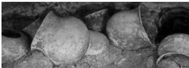
Figura 1: Urnas funerarias del parque arqueológico de Tierradentro