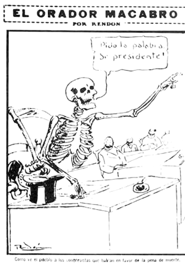
Figuras 2 y 3: Valencia y la Muerte, aliados en la defensa de la pena capital ante el Senado 9

A pesar de las numerosas políticas inicuas a las cuales prestó sus dotes oratorias, Valencia no llegó a los extremos tradicionalistas mostrados por otros conservadores. Por ejemplo, apoyó la causa de la independencia cubana y se permitió apreciar los méritos de la filosofía y la historiografía liberales, y de honrar por igual, en otros tantos discursos, la memoria de su crítico más severo, el caricaturista Ricardo Rendón (1973-1974: 2.82-83), la del radical Rafael Uribe Uribe (2.55-68) y la del involucionista Caro (2.29-39) 10 . Este último no dudó, por el contrario, en condenar en bloque el paradigma ilustrado ni en perseguir a Ezequiel Rojas (defensor del estado laico y la filosofía utilitarista), protestando incluso cuando la Iglesia autorizó su cristiana sepultura en 1873. Tampoco le