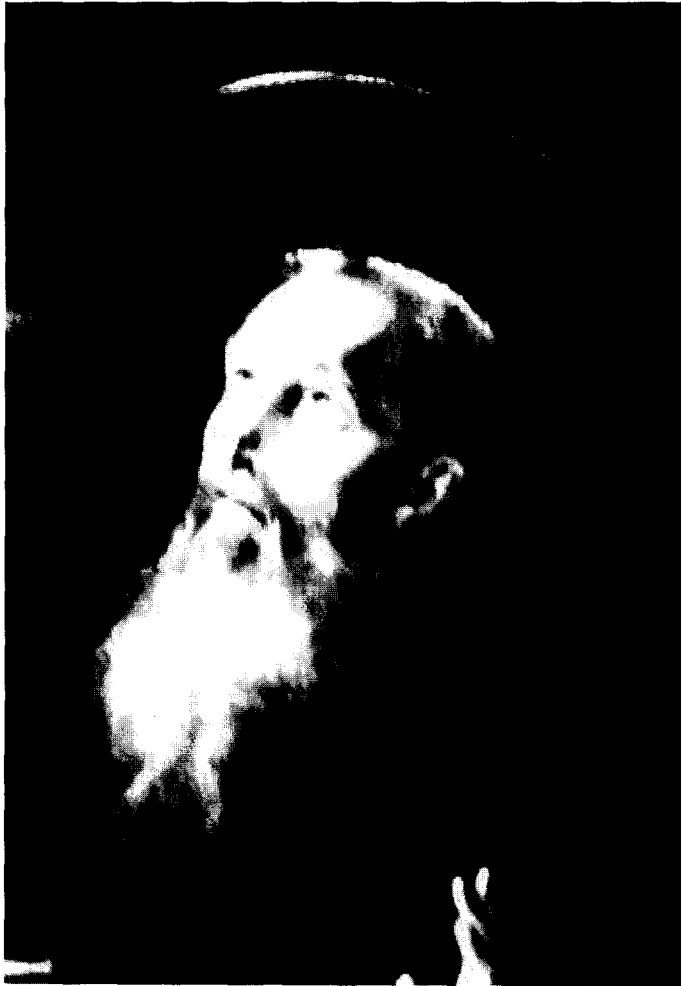
Figura 2. Juan Ricci: San Benito contemplando la ascensión de San Germán. Detalle. Madrid, Colección particular.