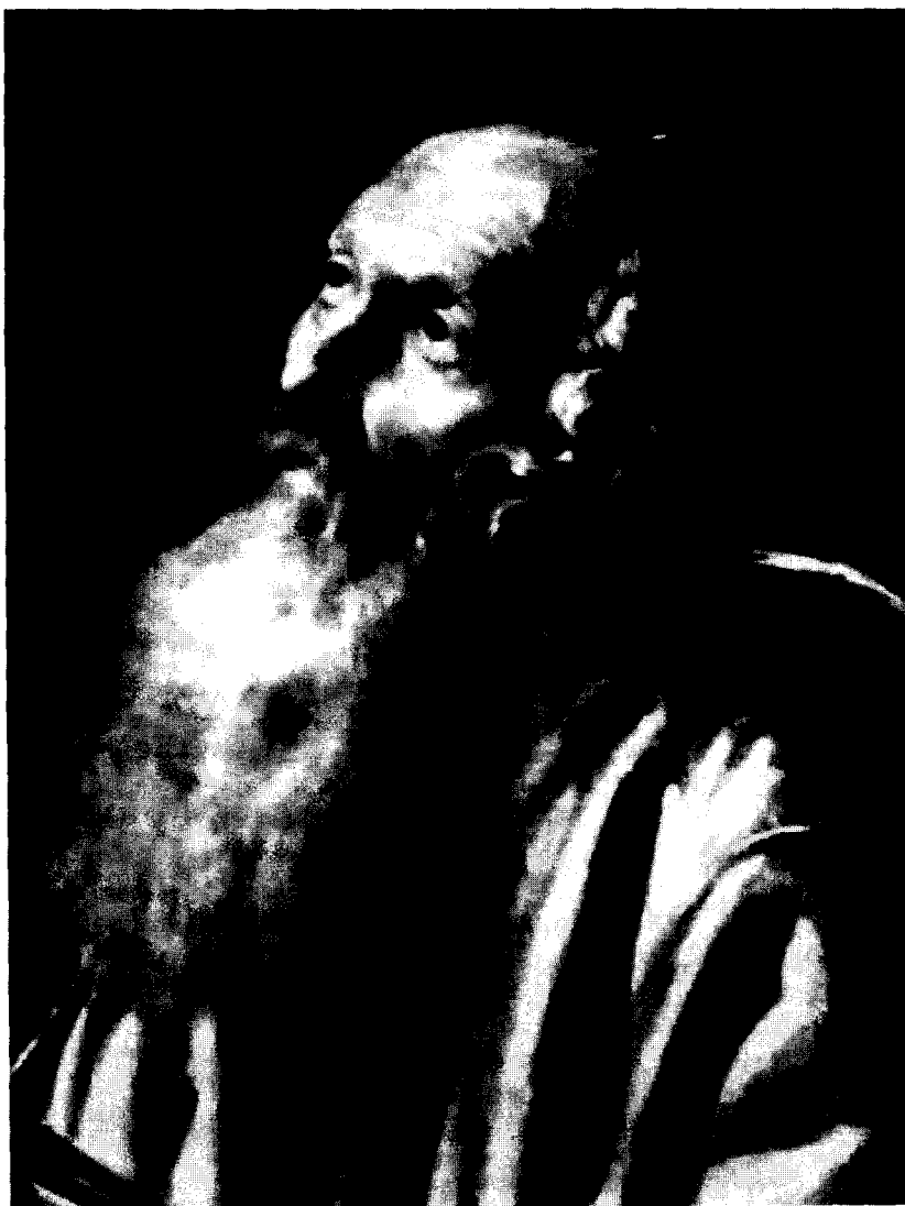
Figura 3. Juan Ricci: San Pablo. Detalle. Monasterio de San Millán de la Cogolla.