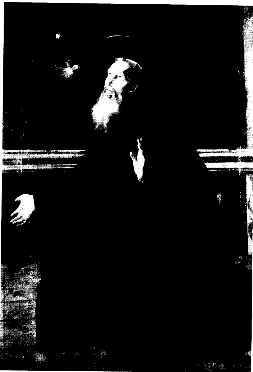
Figura 1. Juan Ricci: San Benito ante la visión del mundo y la ascensión del alma de San Germán. Madrid, Colección particular.