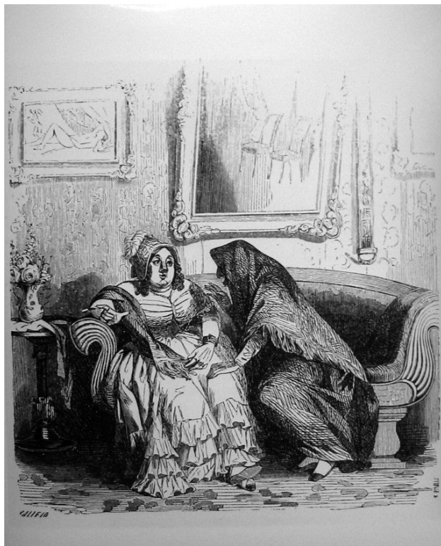
Fig. 2. Entrevista de la tía Esperanza con la marquesa de Turbias Aguas.