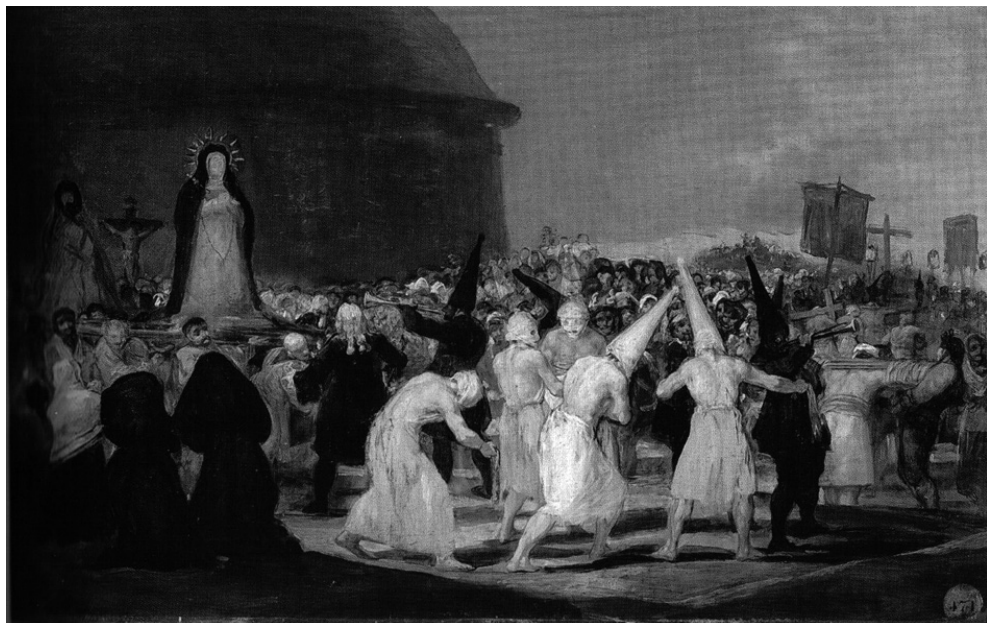
Fig. 2. F. Goya. Procesión de disciplinantes