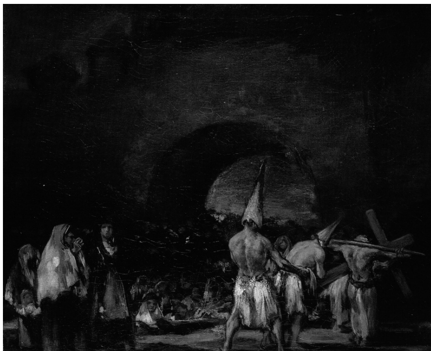
Fig. 3. F. Goya. Disciplinantes junto a un puente