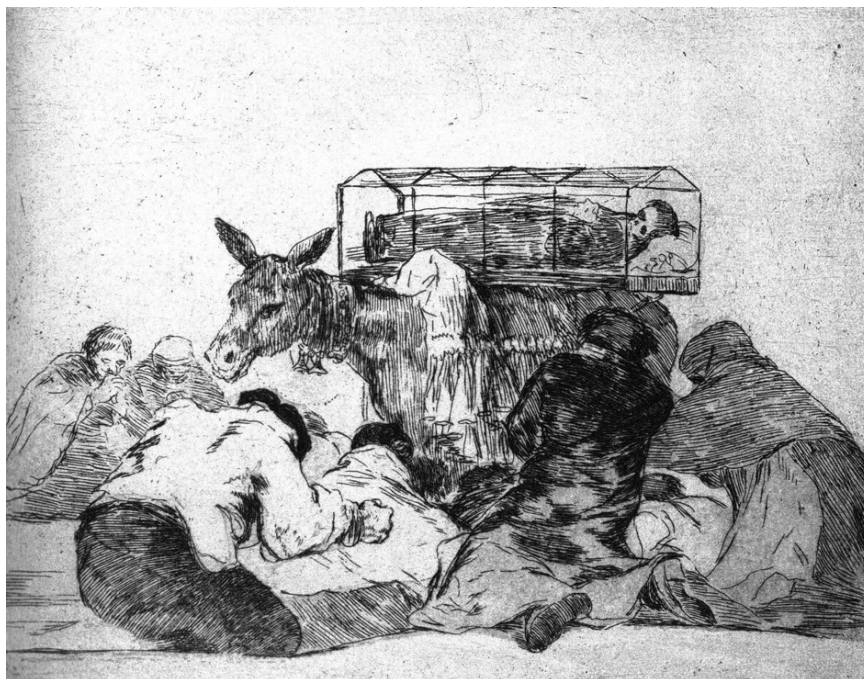
Fig. 5. F. Goya. Esta no es menos