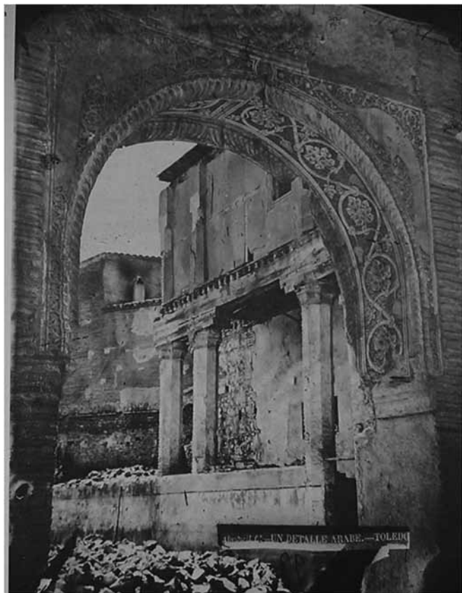
Fig. 4. Arco del palacio del rey don Pedro (Toledo). Finales del siglo XIV.

Tras la publicación de esta obra, los estudios sobre palacios concretos toledanos decaen y se inauguran una serie de estudios transversales sobre la evolución de las estructuras arquitectónicas, como los de Molénat y Passini, que analizan los restos conservados a la luz de la documentación conservada. Esta línea de estudios es relativamente reciente, y profundizar en ella puede aportar nuevas perspectivas interesantes para el estudio de los palacios mudéjares.