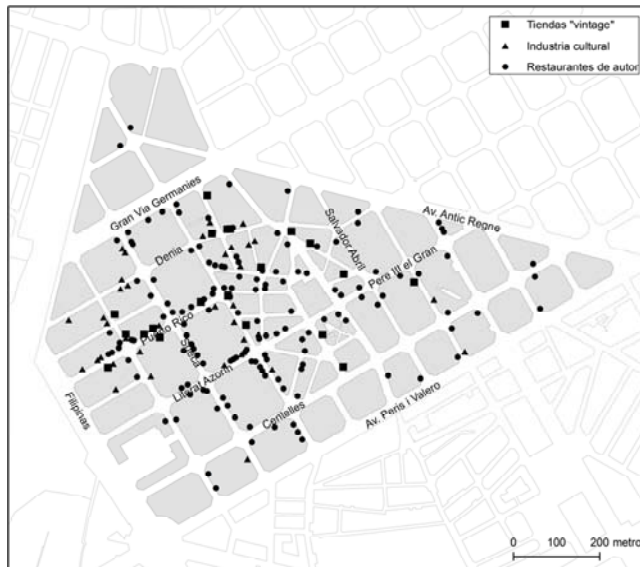
Figura 6. Comercio gentrificado en el barrio de Russafa.