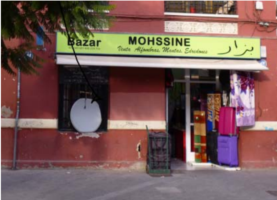
Figura 9. Ejemplos de cambios en establecimientos comerciales: Bazar magrebí transformado en “Foodie place” o pastelería y café “brunch”, desde el año 2014.