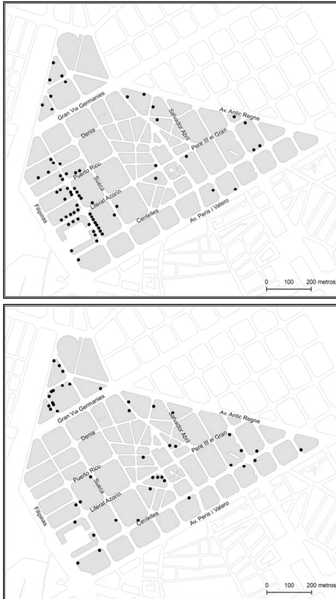
Figura 3. Comercio chino en 2004 (izquierda) y 2014 (derecha).

Fuente: Trabajo de campo y Torres (2007).