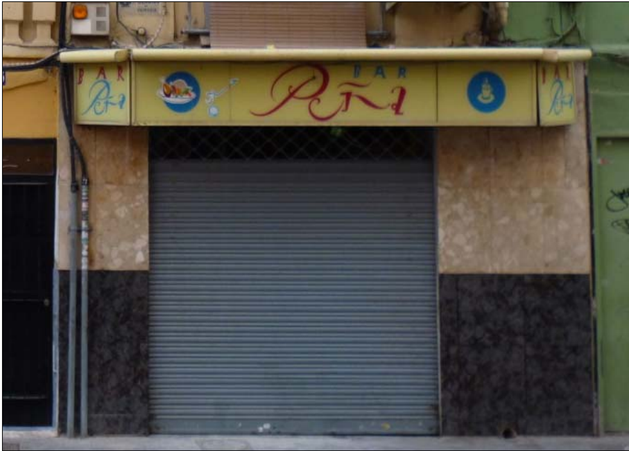
Figura 7. Ejemplos de cambios en establecimientos comerciales: Bar marroquí transformado en “hamburguesería de autor”, a partir del año 2012.