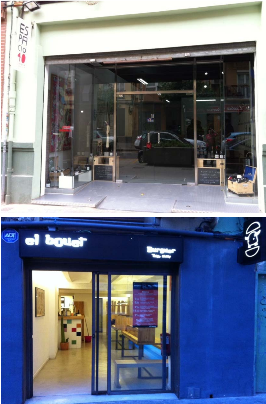
Figura 8. Ejemplos de cambios en establecimientos comerciales: Antiguo comercio chino, hoy vinoteca y galería de arte.