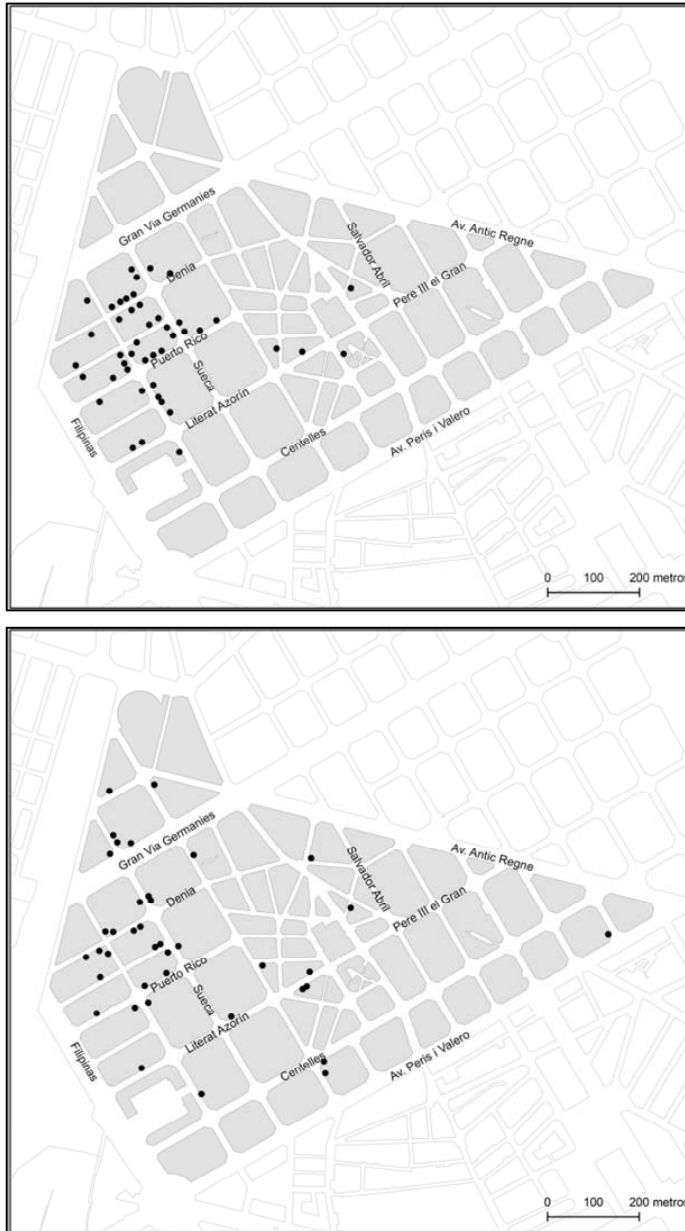
Figura 4. Comercio magrebí en 2004 (izquierda) y 2014 (derecha).