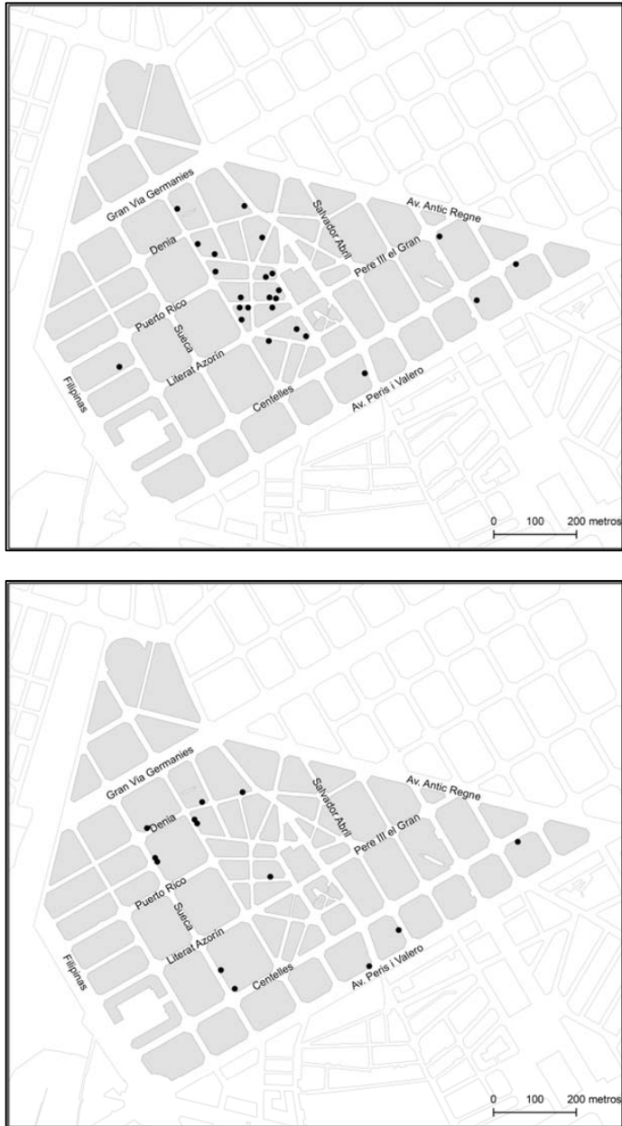
Figura 2. Comercio latinoamericano en 2004 (izquierda) y 2014 (derecha).