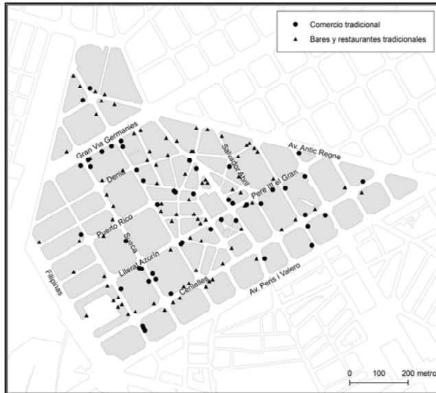
Figura 5. Establecimientos tradicionales y locales de comercio y restauración.