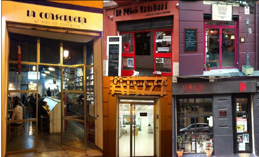
Figura 10. Ejemplos de establecimientos comerciales “gentrificadores”: bar de conservas, librería y galería de arte; tienda vintage o comercio de antigüedades.