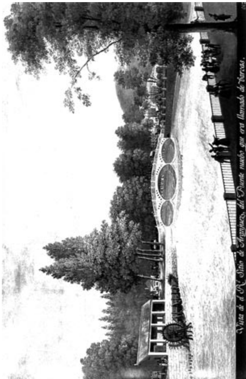
FIGURA 3 Vista del Puente Nuevo o de las Barcas (Fernando Brambilla, 1826-1830)