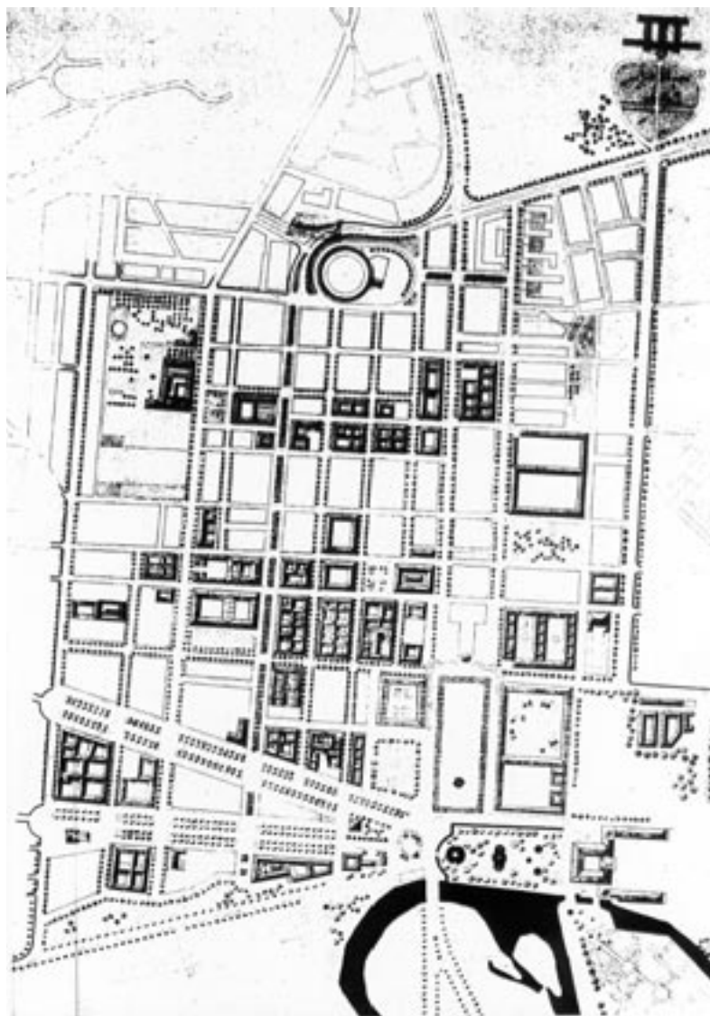
FIGURA 4 Plan Especial de Reforma Interior del Casco. Zonificación: conservación (Moneo, J. R.; Solá-Morales, M.; Busquets, J.; Echevarría, J. J.; Salinas, M. 1980)