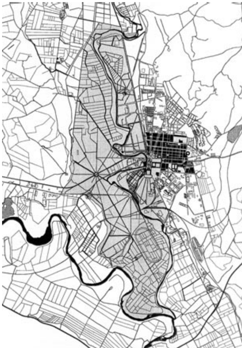
FIGURA 1 Delimitación del Paisaje Cultural Patrimonio de la Humanidad (Aranjuez Paisaje Cultural, 2000)