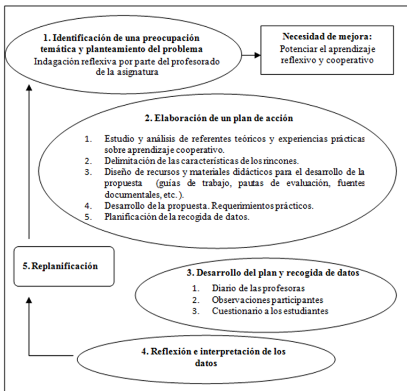
Figura 1: Desarrollo de la investigación-acción (Adaptación de Sandín, 2003).

El proceso de investigación-acción se concibe como una espiral de ciclos que se retroalimentan entre sí y se componen de cuatro fases: planificación, acción, observación y reflexión. Su carácter cíclico implica un “vaivén” (espiral dialéctica) entre la acción (praxis) y la reflexión (teoría), de manera que ambos momentos quedan integrados y se complementan (Latorre, Arnal y Del Rincón, 1996). La siguiente figura recoge información relevante acerca de las fases seguidas en el proyecto: