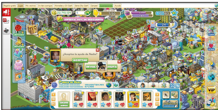
Figura 1. Interfaz gráfica de CityVille

Siempre se fomenta la socialización entre jugadores al potenciar la invitación a amigos de la red social y el acceso a las ciudades de vecinos para ofrecerles obsequios. Además, se visibiliza la interacción entre ellos identificando a los que visitan la ciudad con intención de que se les devuelva la visita y gratifique por ello, mostrando sus puntuaciones y favoreciendo así la competitividad. Se rige por normas que regulan el progreso de los jugadores y promueve la autosuperación, tasada en la promoción de nivel. Ésta, a medida que avanza el juego, se vuelve más exigente, requiriendo mayor participación y actividad de los jugadores para alcanzar niveles superiores (Ducheneaut, Yee y Nickell, 2006).