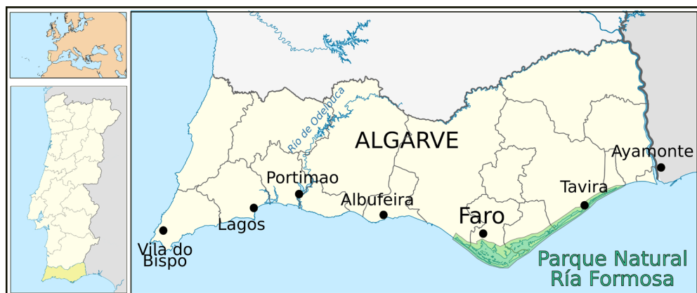
Figura 1. Situación del Parque Natural de la Ría Formosa.

Las áreas en las que se ha llevado a cabo este trabajo comparten muchas similitudes, destacando para el objeto de este estudio, sus humedales de relevancia internacional. En Faro, en el Algarve, está la Ría Formosa (Fig. 1); una de las siete maravillas de Portugal, incluida en la lista de humedales de interés mundial definido por la Convención de Ramsar. Declarada Parque Natural en 1987, abarca una superficie de unas 18.000 ha. Es considerada un área importante de aves (IBA) y es parte de la red Natura 2000. En este geosistema se encuentran, entre una gran riqueza biológica, especies en peligro de extinción como el camaleón, o la mayor población de caballitos de mar del mundo. Además, la ría constituye una importante área socioeconómica, relevante por el marisqueo, el turismo y las actividades recreativas.