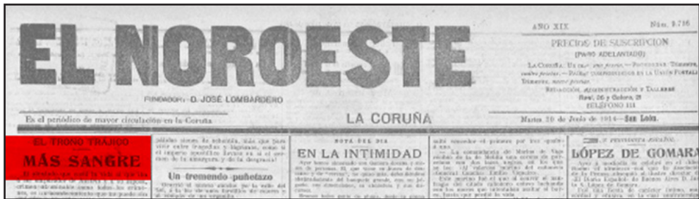
Imagen 8. Cabecera de El Noroeste del 30-06-1914

La noticia sobre el suceso abre la publicación del 30 de junio con una extensión de algo más de una columna en la que la redacción del periódico expresa sus impresiones con respecto al atentado. Los datos más objetivos los relega hacia las columnas finales de la página 2. Igual que el día anterior, las crónicas son mandadas por el corresponsal en la capital española, organizadas en más de una veintena de ladillos que mezclan aclaraciones sobre el propio atentado y las consecuencias derivadas. En lo que respecta a los titulares, el que abre la edición, “Más sangre” (imagen 8), se olvida de la función informativa por una apelativa que llama al lector a leer el cuerpo del texto para conocer cuál es el objeto de la noticia. La segunda parte recicla el titular del día anterior, pero esta vez sin la contextualización de un antetítulo.