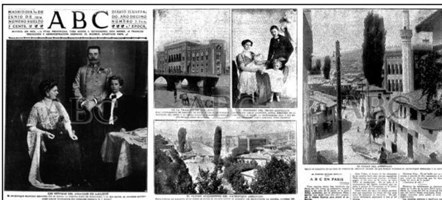
Imagen 5. Reportaje fotográfico en ABC , 30-06-1914

“El archiduque Francisco Fernando era un hombre activo, inteligente y enérgico. La energía que hacía compatible con la bondad de sentimientos y la afabilidad en el trato, era su cualidad más saliente. Anhelaba la prosperidad de su patria y era el auxiliar más eficaz del Emperador, que le confiaba el estudio de los más arduos negocios de estado”, ( Diario ABC , 29-06-1914, p.7).