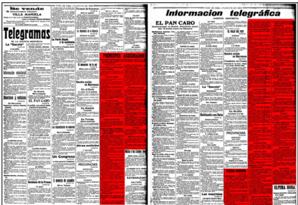
Imagen 7. Páginas de Faro de Vigo de 29 y 30-06-1914 en las que refleja el atentado

El diario del sur de Galicia dedicó espacio al crimen el 29 y 30 de junio en la página 2 ambos días con una extensión modesta y en medio de otras noticias nacionales: mientras que el lunes la noticia no llega a ocupar dos columnas (de un total de seis que tiene cada carilla), el martes sí supera ese tamaño con tres columnas (imagen 7).