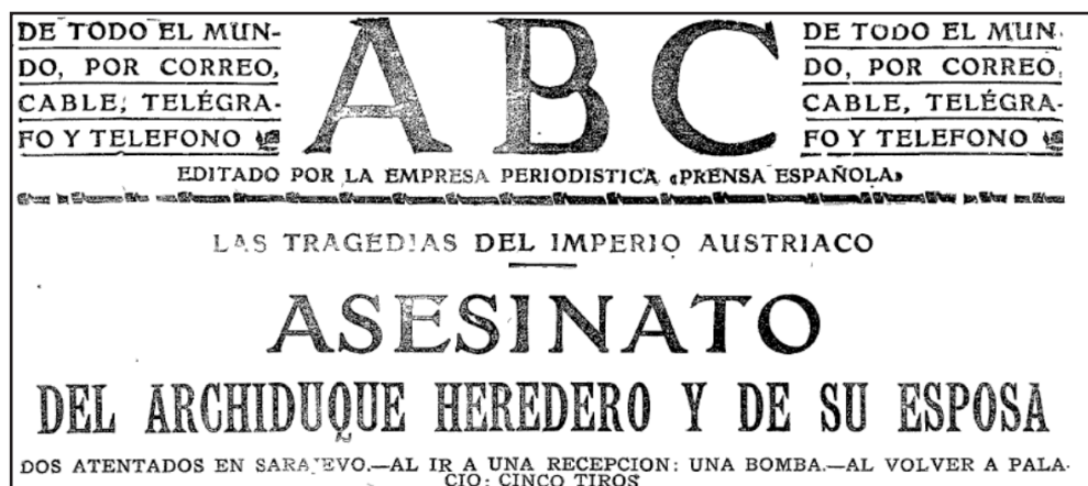
Imagen 4. Encabezado de la página 5 de Diario ABC del 29-06-1914

del periódico) y una página de fotos (página 2) además de un encabezado adicional (imagen 4) como el que emplea en sus portadas.