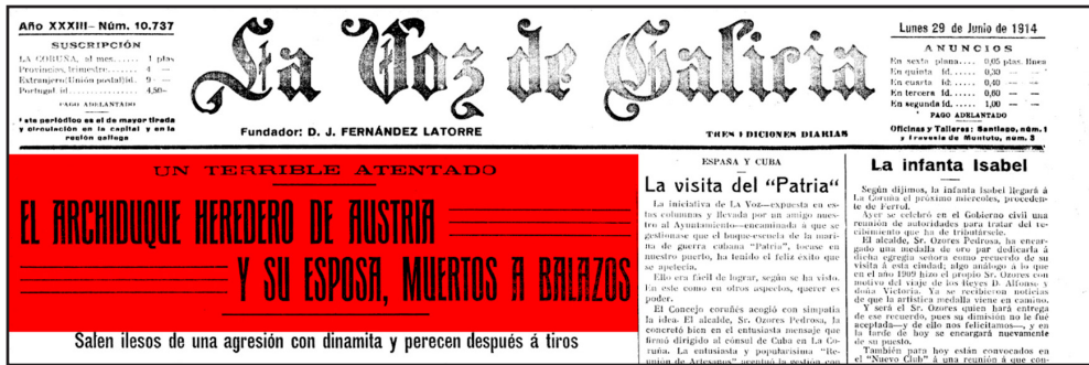
Imagen 6. Cabecera del 29-06-1914 de La Voz de Galicia

columnas de las cinco de su portada a relatar cronológicamente cómo sucedieron los acontecimientos que llegaron por telegramas principalmente desde Viena. La noticia también contempla la reacción de las principales figuras políticas de España y fue a la Embajada primer lugar al que acudieron los periodistas para confirmar la información que les llegaba por telégrafo. Es característico el uso de breves ladillos telegráficos que separan la información por tema tratado y no jerarquizados según su relevancia informativa. En esta noticia se emplean hasta 23 ladillos. El titular (imagen 6), a diferencia de otras entradas del periódico, se presenta en letras mayúsculas, y condensa el qué (muerte), el cómo (a balazos) y el quién (el archiduque heredero de Austria y su esposa).