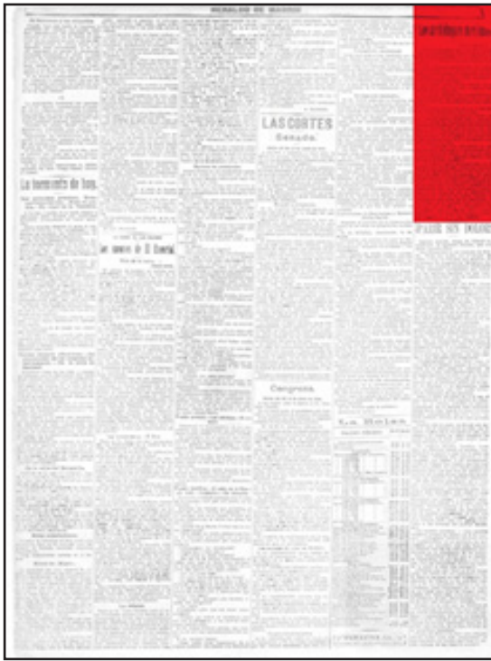
Imagen 3. Cobertura informativa del 30-06-1914

En consonancia con lo anterior, el Heraldo de Madrid comienza la noticia con una alabanza a la Gaceta de Viena por su cobertura informativa y reproduce los elogios que le dedica a la figura del finado. Tras este inicio y sin un recordatorio previo de los acontecimientos principales, el diario madrileño continúa con una línea de redacción ya empleada por otras publicaciones estudiadas: una sucesión de notas breves, sueltas y sin relación unas con otras.