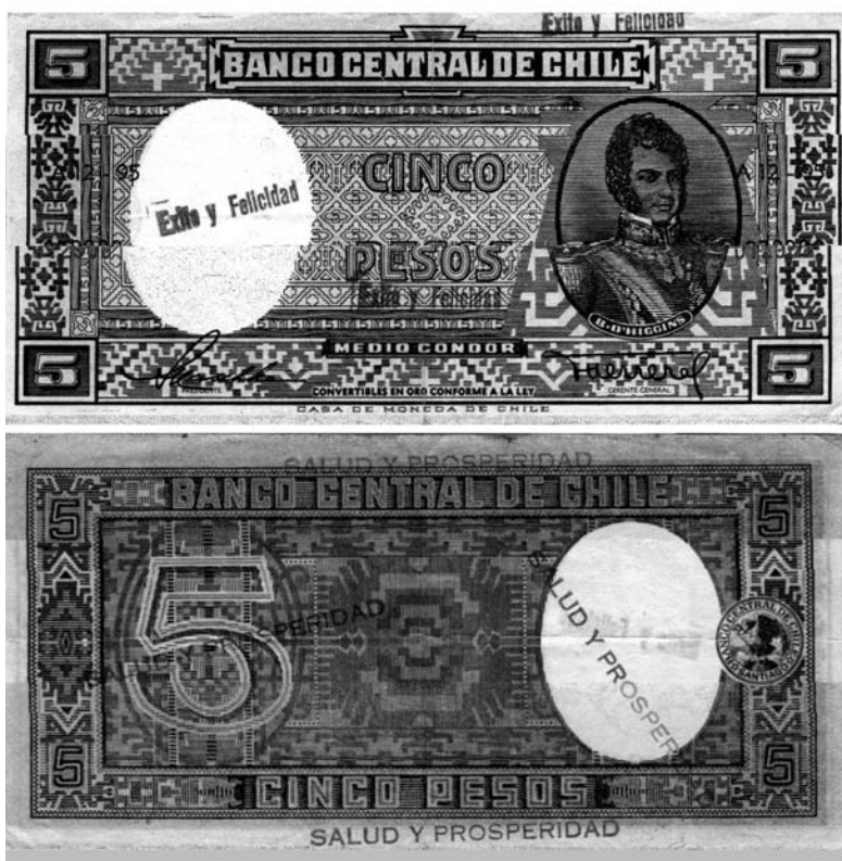
Figura 7. Billeto de 5 pesos, emitido por el Banco Central de Chile entre 1947 y 1959. Figura en anverso y reverso graffiti estampillado, obra de algún representante del Evangelio o la Teología de la Prosperidad en fecha imprecisa. (Colección del autor).

en sus etapas de bonanza y crecimiento económicos. Consistiría en una lectura en alto grado tendenciosa y aberrante del Evangelio que exaltaría el materialismo y consideraría la Fe como un motor económico, prometiendo el aumento milagroso de los recursos a todos aquellos que invirtiesen su dinero en el Reino de Dios. En su planteamiento, se estimaría al sano y al rico como personas elegidas o bendecidas por Dios, estimando la pobreza y la enfermedad como estados malditos 8 . Aunque cabría pensar en la posibilidad de cierta analogía entre la magia y este recurso de los billetes sellados con deseos o bendiciones y a un nivel de religiosidad popular funcionasen de este modo, más bien estos lemas generalmente se configurarían como manifestación escueta de un programa doctrinal o ideológico, a través de un soporte altamente simbólico. Evidentemente, esto incluiría también una función propagandística, con el fin de captar adeptos, basada en la ingenua impresión que podría causar la masiva profusión de estos billetes marcados entre la población que asociaría la riqueza con la pertenencia a un determinado grupo social.