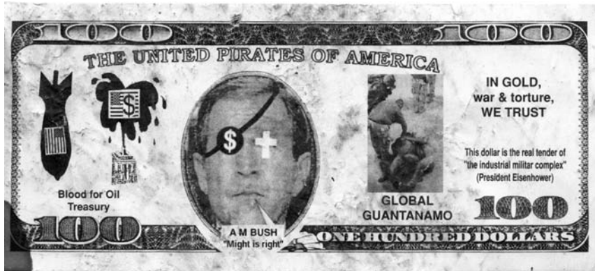
Figura 9. Pseudobillete de 100 dólares (anverso), perteneciente a la campaña de propaganda contra la Segunda Guerra del Golfo, datable en Madrid en 2004 ó 2005 y obra de algún colectivo indeterminado. (Colección del autor).

el entorno de los pasquines, lindando con el mundo del graffiti y sus códigos expresivos, como podrá observarse en el análisis más adelante de un billete de 5 dólares grafiteado (fig. 12).