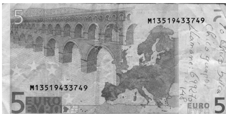
Figura 5. Billete de 5 euros, emitido por el Banco Central Europeo en 2002. Figura en su reverso un graffiti gay de contacto, realizado por un particular en España entre 2002 y 2006. (Colección del autor).

lismo entre el graffiti en billetes y el graffiti de servicios públicos o latrinalia . Aunque exista una insoslayable diferencia física en el soporte, que impide dotar al primero del peculiar valor simbólico o de la estigmatización cultural asignados a esos espacios reservados ni de su desarrollo textual amplificado; lo favorable de los billetes como soportes para ejercitar en la intimidad la práctica del graffiti hace que aparezcan temas o tratamientos típicos del graffiti dado en servicios públicos. Algunas circunstancias coincidentes como esa intimidad, el anonimato o la probabilidad de una presencia continuada y variada de receptores, a lo que se sumaría, en este particular, la despenalización oficial de la homosexualidad y la permisividad moral de la sociedad actual en España, serían claves para poder considerar, primero, que no hay porque estimar este graffiti como una broma o engaño, aunque sería también una opción muy posible 5 , entrando en la categoría «a»; y, segundo, apreciar cómo el grado de tolerancia o represión hace que ciertas producciones de graffiti amplíen o reduzcan su espacio de desarrollo o tengan tal o cual desarrollo en su forma y contenido. En este sentido, este tipo de mensaje se liberaba de algunas pautas clásicas en tiempos de persecución y castigo, tocantes a la exigencia de precaución (pruebas de la seguridad del emisor, la discreción en dar datos o la petición de formalidad, por ejemplo) 6 .