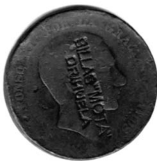
Figura 4. Moneda de 10 céntimos, acuñada entre 1877 y 1879. Figura sobre su anverso un graffiti publicitario, realizado por una empresa fabricante de sillas en Orihuela (Alicante, España) probablemente en las décadas de 1920 ó 1930. (Colección del autor).

En este caso, acudiré a una muestra, para observar cómo se planifica este uso. De nuevo se trata de una moneda de 10 céntimos de Alfonso XII, cuyo año de acuñación no se puede precisar por el desgaste, entre 1877 y 1879 (fig. 4). Sobre su anverso, matando la cara del rey, aparece en dos líneas: «SILLAS “MOTA”» / «ORIHUELA». No obstante, este acto de damnatio no parece acusar un sentido político, aunque en verdad este recurso publicitario es bastante extraordinario. Pero, posiblemente nos pueda orientar acerca de la fecha de ejecución hacia un período comprendido