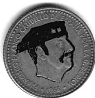
Figura 3. Moneda de 1 peseta, acuñada en 1969. Tiene en su anverso un graffiti realizado por un particular, realizado con motivo de la intentona golpista del 23 de febrero de 1981 a cargo del teniente coronel de la Guardia Civil, Antonio Tejero Molina. (Colección del autor).