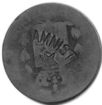
Figura 1. Moneda de 10 céntimos, acuñada en 1878. Figura un graffiti en su reverso, obra de las Juventudes Socialistas, probablemente realizado entre el final de 1917 y principios de 1918. (Colección del autor).