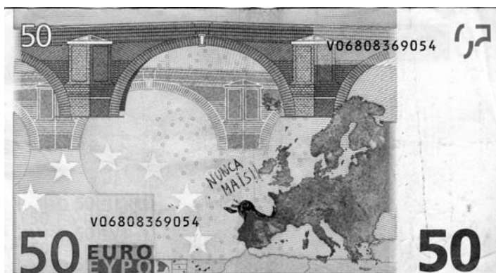
Figura 10. Billeto de 50 euros, con un graffiti en su reverso con motivo del desastre ecológico del buque petrolero Prestige . Obra de un particular hacia finales de 2002 o primera mitad de 2003.

propia ideología o para asentar la contundencia de su protesta. Por ejemplo, con motivo del desastre ecológico del buque petrolero Prestige frente a las costas gallegas en noviembre de 2002, al hilo de las movilizaciones bajo el lema « Nunca Más » (Nunca Más), aparecieron billetes que representaban, en su extensión desde Portugal a Francia, la mancha costera de chapapote sobre el mapa de Europa junto a dicho lema (fig. 10). Un modo de tomar conciencia del carácter europeo e internacional del suceso y de la política medioambiental como una prioridad. También, en España de modo más sistemático la Red Ciudadana por la Abolición de la Deuda Externa (RECADE) desarrolló una campaña de propaganda en el 2005, bajo el lema «¿Quién debe a quién?», en la que tuvo en cuenta este medio en sus acciones de calle junto a pancartas, carteles y pegatinas (fig. 11). Indudablemente, el empleo del dinero en este contexto subrayaba el significado de la acción de protesta y demanda, en algu-