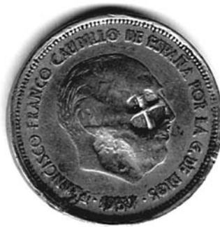
Figura 2. Moneda de 25 pesetas, acuñada en 1959. Contiene en el anverso una damnatio sobre su retrato, obra de algún particular o grupo contrario al Régimen franquista. (Colección del autor).

que nos hallamos ante un acto de damnatio : se ha matado mediante un punzón con matriz con una cruz inscrita en un círculo sobre el ojo del retrato en perfil del dictador. Respecto al porqué de esta forma o sobre su autoría y momento concreto de su realización no tengo ninguna pista que lo aclare. No obstante, parece obra de algún particular o grupo contrario al Régimen, independientemente de su ubicación en uno u otro extremo del espectro político.