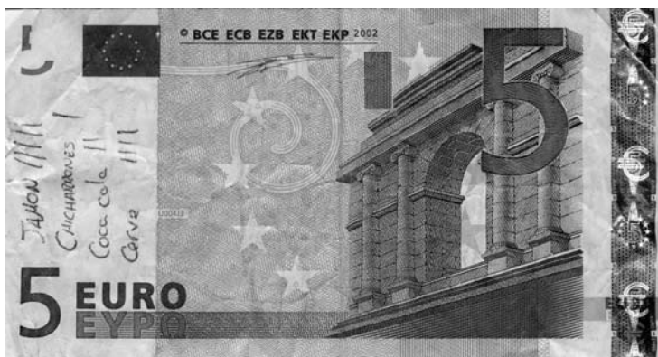
Figura 6. Anverso del billete anterior, donde figura un graffiti puntual y particular realizado con motivo de la contabilidad de consumiciones en un bar o bocadillería, entre 2002 y 2006. (Colección del autor).

Dentro del otro grupo, tendríamos el ejemplo localizado en el anverso del mismo billete con un evidéntísimo carácter puntual y que comparte con el ejemplo anterior el hecho de hacerse sobre la parte blanca del billete, para procurar una correcta legibilidad (fig. 6). Por tanto, este otro se situaría en el tipo «e», pues no parece obra de alguien en el desempeño de su trabajo (por ejemplo, un camarero), sino de un miembro de un grupo de seis clientes de algún bar o bocadillería. Así pues, el texto a modo de listado parece referirse a la contabilidad de las consumiciones realizadas por dicho grupo, bocadillos seguramente y bebidas: «JAMON IIIII» / «CHICHARRO-NES I» / «Coca Cola II» / «Cerve IIII». Aquí podría apreciarse la existencia de algún factor de tránsito o urgencia que haya hecho desestimar la búsqueda de otro soporte más usual, como una servilleta de papel. También, la posibilidad de un factor de corte ideológico que haga factible el desprecio y la profanación gráfica del dinero, prefiriendo escribir sobre un billete que, por ejemplo, sobre la palma de la mano.