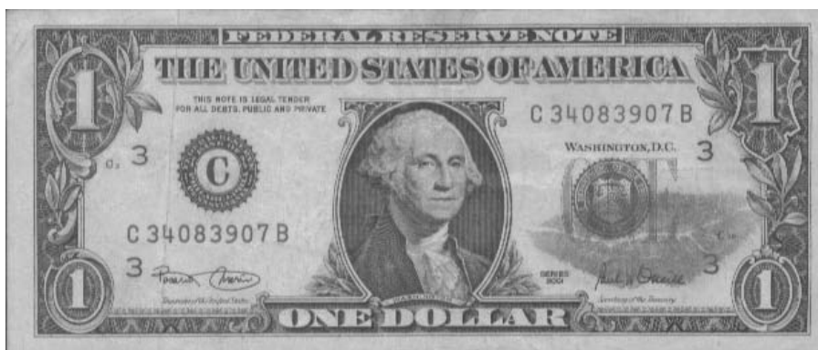
Figura 13. Billeto de 1 dólar, con la huella con carmín de unos labios, de autoría particular y datación indeterminada. (www.badexample.mu.nu, diciembre, 2005).

Por contra, algunos otros autores realizan graffiti de exaltación del dólar. Por ejemplo, algún escritor de la cultura Hip Hop , con la vinculación de su firma con el dinero, podría establecer una apología del dinero como símbolo de fortuna o poder personales, garantía de respeto social y de valorización personal. Incluso es habitual encontrarse leyendas, a mano o estampadas, que bendicen o ensalzan estos billetes: « BLESSED » (bendito), « uR#1 » (tú eres el número uno), « I♥u! » (te amo), la huella de carmín de unos labios (metonimia del beso, como acto de bendición), etc. Aunque en ciertos casos, lo abierto de las interpretaciones y de las posibles circunstancias en que se realizaron, podría llevarnos al terreno de los mensajes confiden-