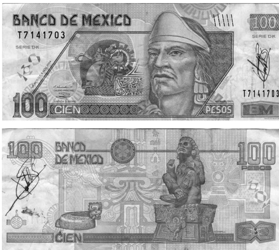
Figura 14. Billeto de 100 pesos, emitido por el Banco de México a partir del 5 de noviembre de 2004. Figura en anverso y reverso una firma autógrafa, posiblemente correspondiente a la identidad «Justo R S» y realizada entre finales de 2004 y 2006. (Colección del autor).

Finalmente, hay que señalar que tras esta etapa de vulgarización del dinero como objeto, —quizás la causa clave de la proliferación de este tipo de graffiti—, podemos entrar, en un futuro, en una fase histórica en la que se asista en Occidente a la casi completa virtualización monetaria (talones, tarjetas de crédito, monederos electrónicos, etc.) Esta situación, consecuentemente, podría tener aparejada la desaparición de las monedas y billetes, planteando la extinción misma de este graffiti como práctica cultural. Evidentemente, en esta nueva transformación de los modos de interrelación social y personal, también el impulso humano por transgredir y hacerse ver buscará nuevos cauces para realizarse en esos marcos alterados.