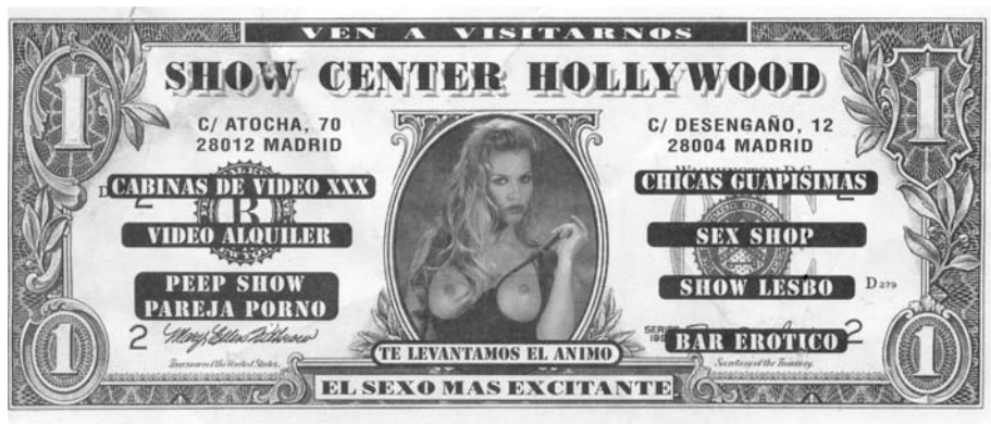
Figura 8. Invitación realizada a modo de billete de 1 dólar (anverso), como publicidad de un local comercial porno-erótico de Madrid, en la década de 1990..

sis de su anverso. En él, la “entidad emisora” se titulaba como « THE UNITED PIRATES OF AMERICA » (Piratas Unidos de América), funcionando como una denuncia directa contra la política internacional de los Estados Unidos de América. y la administración del presidente George W. Bush. Asimismo, el valor nominal de 100 dólares se presentaba como un guiño anticapitalista, que reitera el afán avaricioso de una oligarquía petrolífera y armamentista. A todo esto se añade lo que se asemeja a la huella de un dedo ensangrentado, la mención a cierta “entidad financiera”, « Blood for Oil Treasury » (Tesoro de la Sangre por Petróleo), y la cita de una declaración atribuida al presidente Dwight David Eisenhower, « This dollar is the real tender of “the industrial militar[sic] complex” » (este dólar es la moneda corriente del complejo industrial militar), para recalcar la idea de que se trata de un dinero sucio, indigno. A esto se suma el volteo de lemas tradicionales como « IN GOLD, war & torture, WE TRUST » (creemos en el oro, la guerra y la tortura), que se correspondería con el « In God We Trust » (creemos en Dios), o la atribución en boca de Bush de la frase « A M[sic] BUSH “Might is right” » (soy Bush, el derecho de la fuerza) y que incidían en la carencia de miramientos éticos, estableciendo como patrón de referencia la Declaración de los Derechos Humanos; desde una posición de poder hegemónico, para la consumación de sus intereses fanático-materialistas.