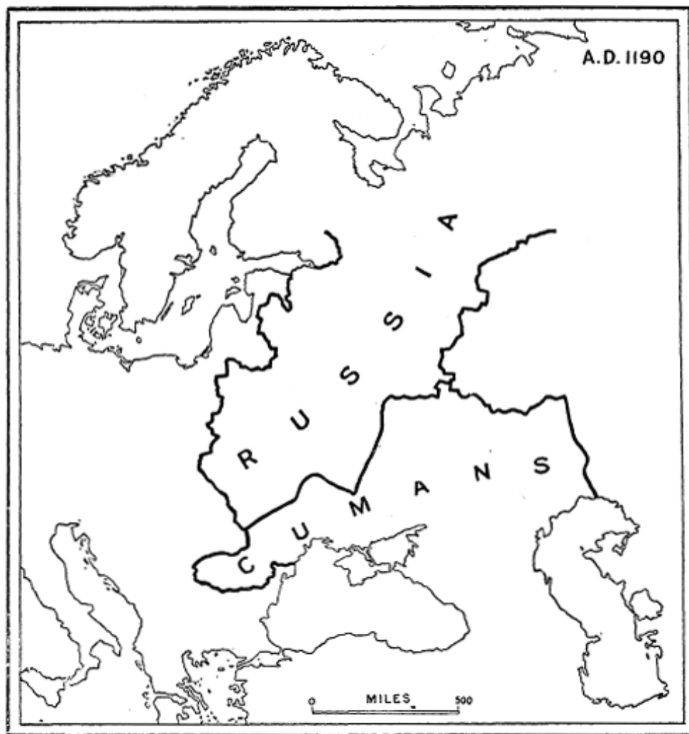
Figura 2. División política de Europa Oriental en la época de la Tercera Cruzada

blecieron al sur del Danubio una casta dominante, habiendo dejado su nombre en el mapa, aunque su idioma se ha rendido ante sus súbditos eslavos.