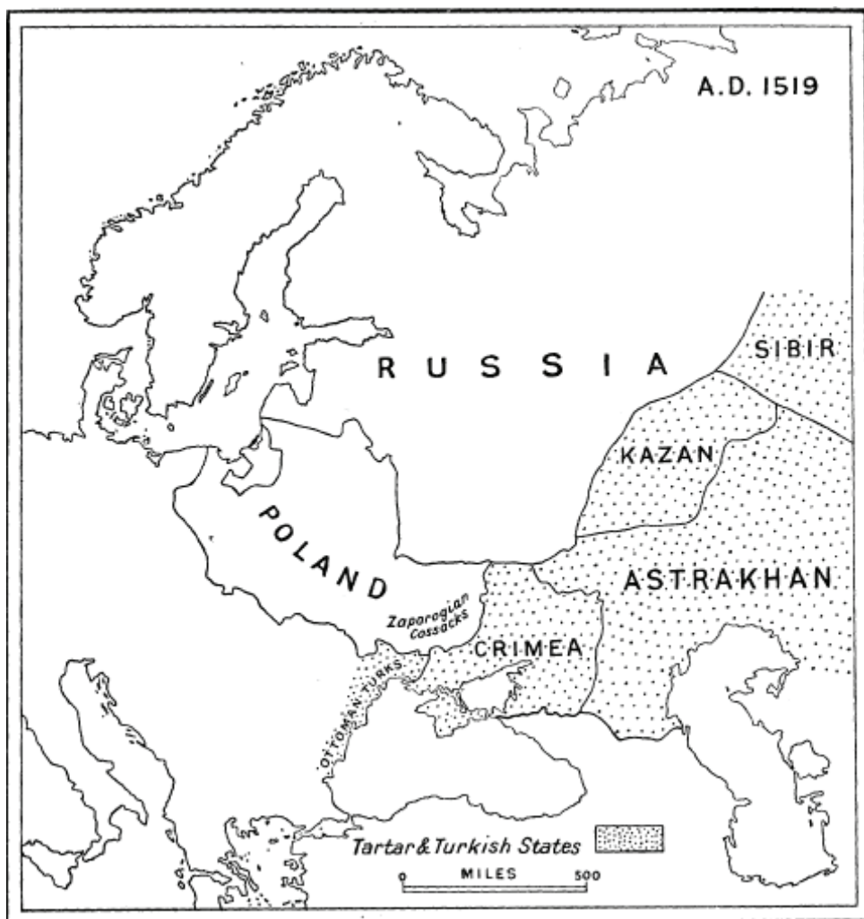
Figura 3. División política de Europa Oriental al llegar al trono Carlos V

Darbishire & Stanford Ltd. Fuente: Realizado a partir del Oxford Historical Atlas .