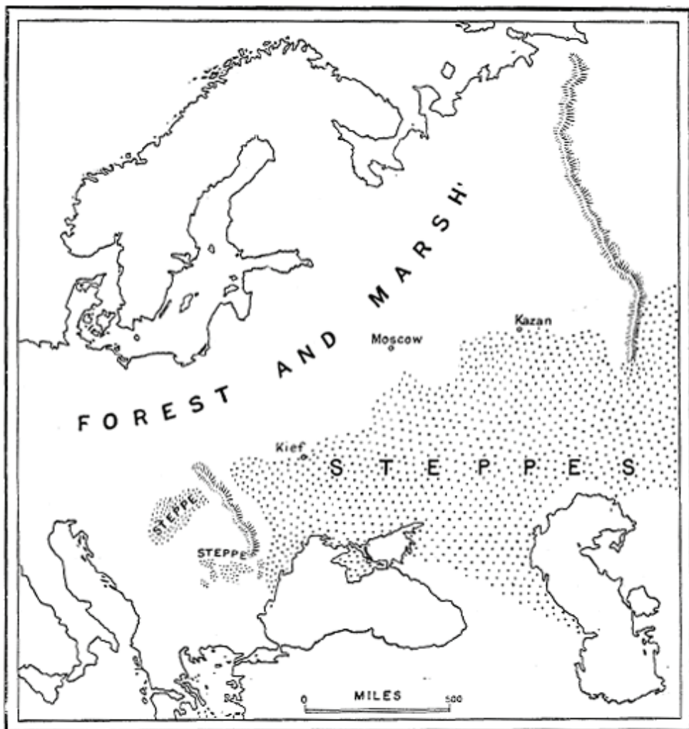
Figura 1. Europa Oriental antes del siglo XIX