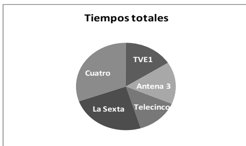
Gráfico 5. Tiempos totales el 17 de abril de 2013. Fuente: elaboración propia.

En la cobertura del miércoles 17 de abril, comprobamos que, en términos absolutos, la cadena Cuatro fue la que más tiempo dedicó al atentado de Boston con 14'22'', seguida de La Sexta con 11'25''. A continuación, aparecen TVE 1 con 7'28'', Antena 3 con 7'22'' y finalmente Telecinco con 6'27''.