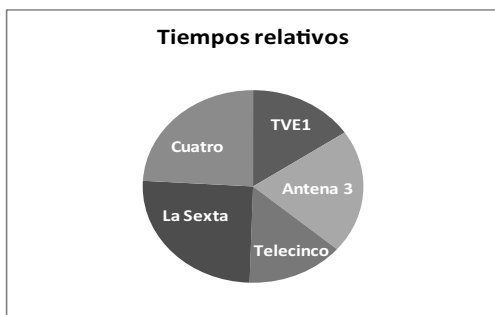
Gráfico 4. Tiempos relativos el 16 de abril de 2013.

En la cobertura del miércoles 17 de abril, comprobamos que, en términos absolutos, la cadena Cuatro fue la que más tiempo dedicó al atentado de Boston con 14'22'', seguida de La Sexta con 11'25''. A continuación, aparecen TVE 1 con 7'28'', Antena 3 con 7'22'' y finalmente Telecinco con 6'27''.