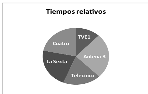
Gráfico 6. Tiempos relativos el 17 de abril de 2013.

En términos relativos en función de la duración total de los informativos, observamos que Antena 3 fue la que mayor cobertura realizó con un 21'20%, seguido de La Sexta con un 18'33%, de Cuatro con un 18'22%, de Telecinco con un 15'65% y TVE 1 con un 10'11%.