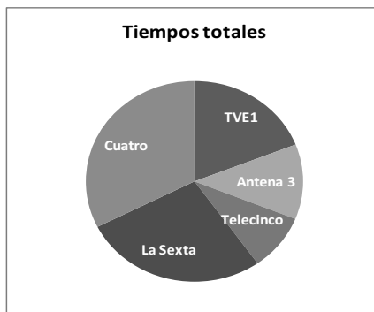
Gráfico 3. Tiempos totales el 16 de abril de 2013.

Del estudio se desprende que Cuatro ha sido la cadena que más tiempo dedicó a informar el día después del atentado de Boston, en términos absolutos, con 31'14", seguido de La Sexta con 26'18", y a continuación están TVE 1, con 18'17"; Antena 3 con 11'37" y, finalmente, Telecinco con 8'43".