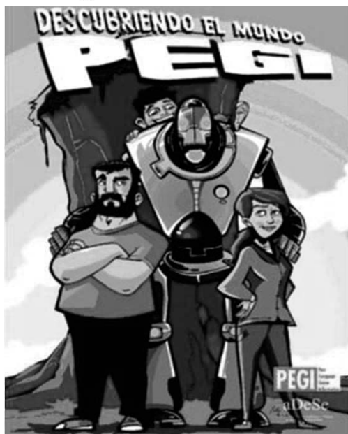
Fig. 3.: Descubriendo el mundo PEGI

En estas últimas Navidades, Europa Press, informaba que de nuevo aDeSe ponía en marcha, por segundo año consecutivo, una campaña de divulgación en torno al Sistema PEGI. En concreto, la campaña estaba basada en la distribución de un cómic en más de 650 puntos de venta de los principales centros de distribución de videojuegos.