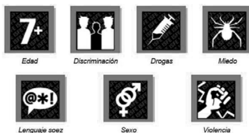
Fig. 1.: Edades y descriptores del código PEGI

formation) ( www.pegi.info ). Actualmente se utiliza en la mayor parte de Europa, en 30 países (Austria, Dinamarca, Hungría, Letonia, Noruega, Eslovenia, Bélgica, Estonia, Islandia, Lituania, Polonia, España, Bulgaria, Finlandia, Irlanda, Luxemburgo, Portugal, Suecia, Chipre, Francia, Israel, Malta, Rumanía, Suiza, República Checa, Grecia, Italia, Países Bajos, República Eslovaca y Reino Unido). Además, está respaldado por los principales fabricantes de consolas, incluidos Sony, Microsoft y Nintendo, así como por editores de juegos interactivos de toda Europa (aDeSe, 2004).