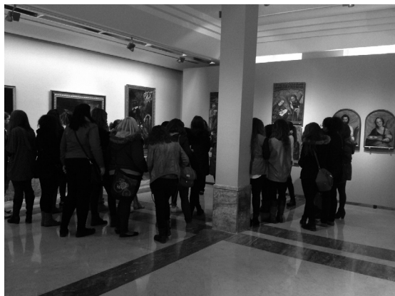
Imagen 2. El voluntariado intergeneracional en el museo.

En el desarrollo comunitario, corresponde al Trabajo Social alimentar un proceso que facilite que las personas mayores o los grupos de mayores se pongan en marcha o sean agentes del propio desarrollo, trabajando para facilitar a la comunidad el desarrollo de los propios recursos, del tejido social o comunitario, para superar carencias y facilitar el crecimiento en todos los sentidos. Tal y como indica Jaraíz (2012), a nadie se le escapa que este nuevo escenario, más complejo, obliga al agente de Servicios Sociales