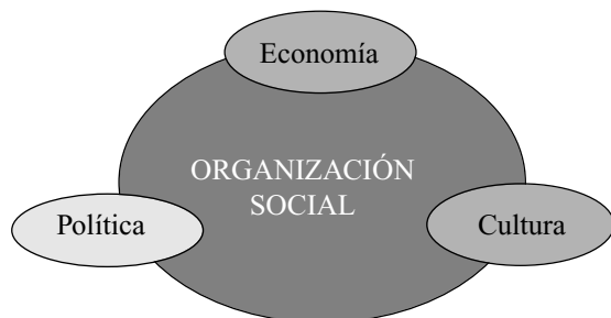
Figura 2. Los tres dominios de la vida social. según Waters (2001).