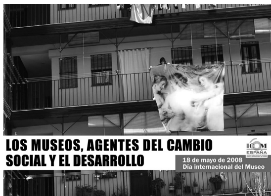
Imagen 1. Cartel del Día Internacional de los Museos de 2008.

En este artículo tratamos de acercarnos a este fenómeno, partiendo de una reflexión teórica sobre la relación histórica entre el museo y la in-